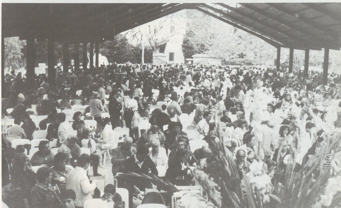
L'Acolliment del Centenari de gom en gom.