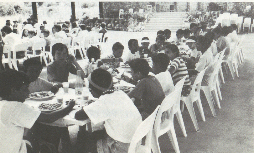
Els nins del Sahara i Lluç compartint el dinar.

El diumenge dia 3 va ésser enllestida a l'Acolliment del Centenari la Primera Mostra dels animals domèstics de Raça autòctona de Mallorca. La va patrocinar l'Ajuntament d'Escorca i la va organitzar el patronat de Races autòctones de Mallorca. Foren moltes les persones que durant la jornada visitaren la mostra.