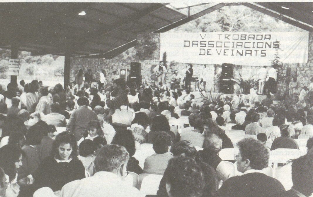
Trobada d'Associacions de Veïnats de Ciutat.