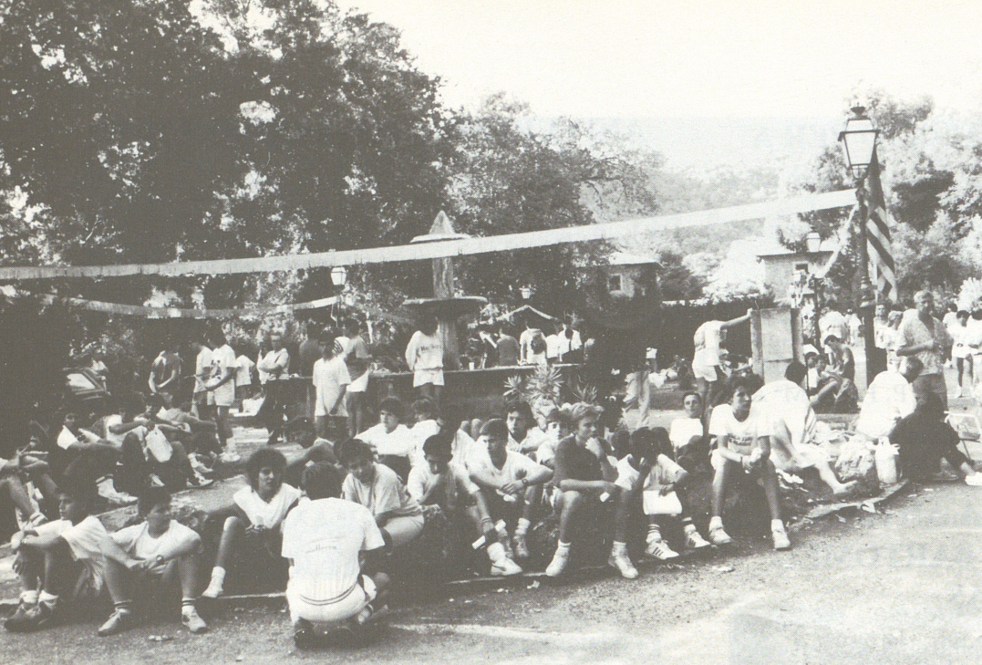
Repòs després de la Caminada.

gom. La popular revetla, ben concorreguda i amb molta assistència de grups folklòrics, en precaució, es féu a l'Acolliment. La nit del 10 al 11 es vegé alegrada amb la "VII Pujada a peu de la Part Forana". Els pelegrins foren uns 5000 tot i que plovia en alguns indrets poc abans de la sortida. A la cova del Puig de N'Escuder, fantàsticament il·luminda, actuà la Coral dels Antics Blauets. Al Salt de la Bella Dona escenificaren la bella llegenda. Per als qui venien de la serra pel camí de Sóller, va actuar el grup "Música nostra". Recitaren la poesia