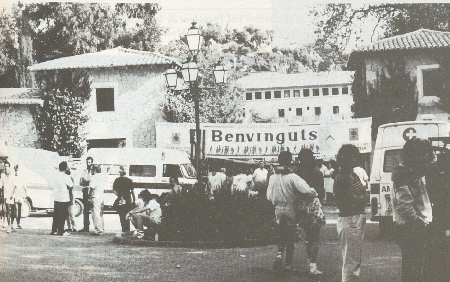
Arribada d'es Güell a Lluç a peu.

El dia vuit començaren les Festes, seguint el programa imprès que aquest any duia com a portada un fermós dibuix dels Porxets. Les banderetes que endiuemenjaven la plaça i la bandera gran del centre eren solament les de Lluç: de colors blanc i blau. Predicà el tridu el novell diaca Miquel Mascaró. El dissabte, a l'hora de sortir la processó cap al Pujol de la Trobada el cel estava encapotat. Arribats al cim, a causa del mal temps, ens obligà a una baixada precipitada; però férem la commemoració dins la Basílica plena de gom en