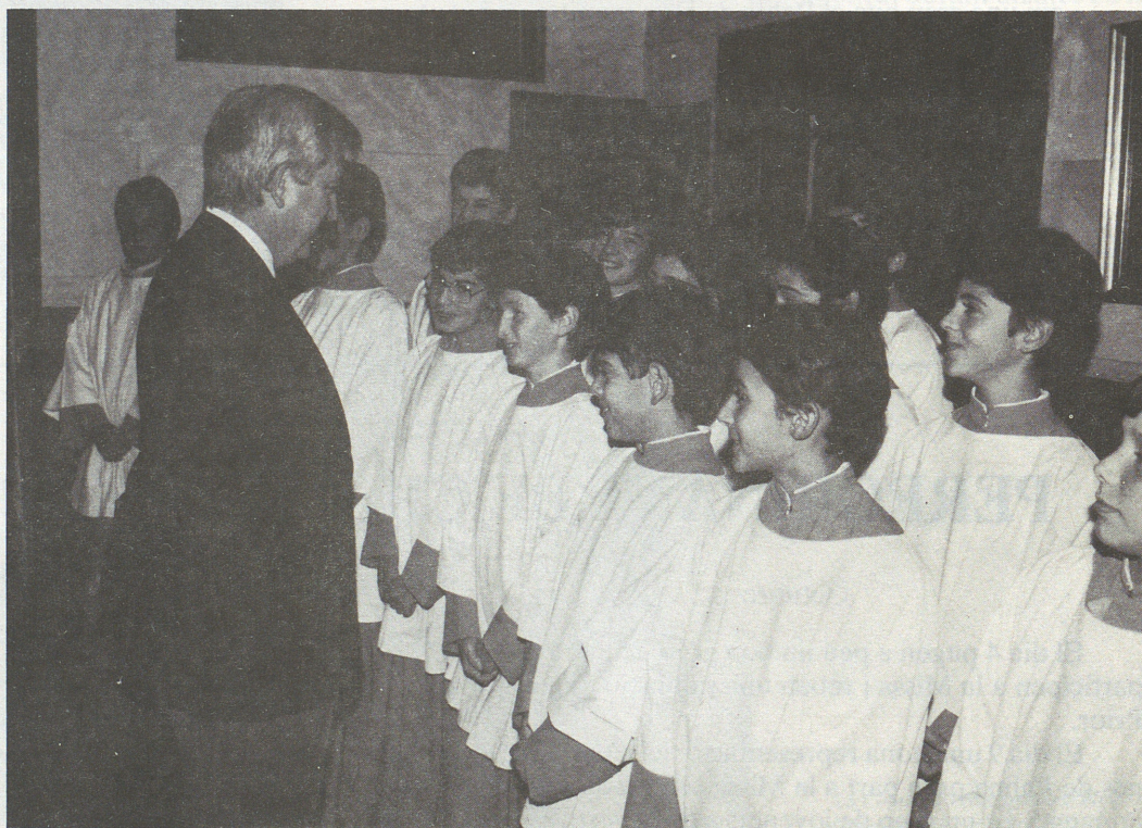
El President del Govern Balear saluda l'Escolania.

El dia 18 arriben un centenar de persones de Bunyola que participen la Missa de les 11'30 h.