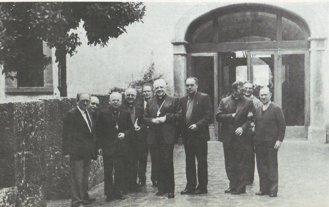
La Comissió Episcopal dels Medis de Comunicació Social a Lluc.