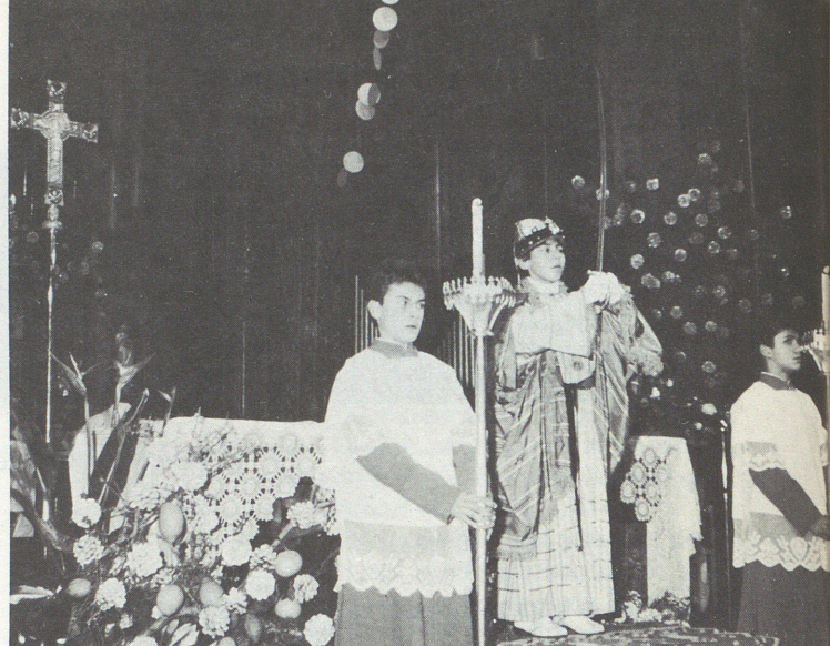
La Sibil·la 1987

Ens plau copiar aquestes paraules de Jaume Fuster al diari "AVUI" de Barcelona: "Val la pena viure un Nadal a Mallorca per assistir, tan si sou creients, com no, al cant de la Sibil·la al Monestir de Lluc, on l'execució del cant és d'una perfecció absoluta".