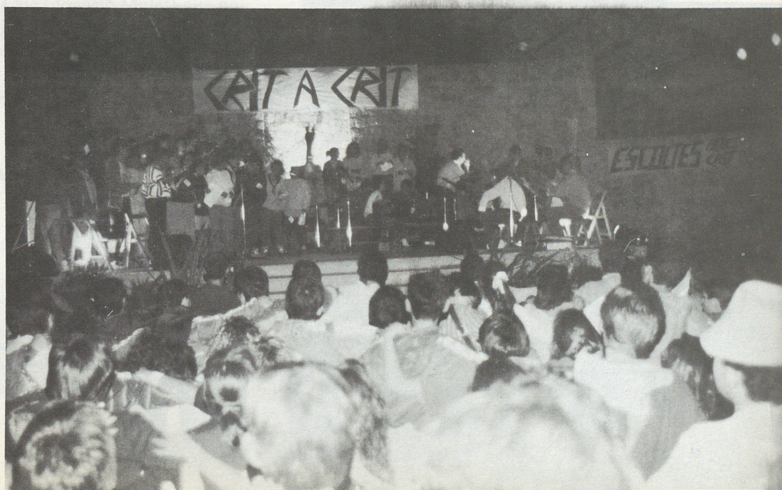
Vetla Juvenil a Santa Maria.

Uns dies abans la TV-3. de Catalunya amb gran muntatge de focus i maquinària de filmació feu gravacions de la Sibil.la i altres cançons nadalenques, que, la