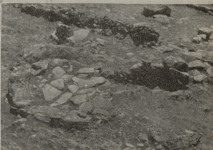
3. — Habitación excavada junto al Talaiot circular con rampa.