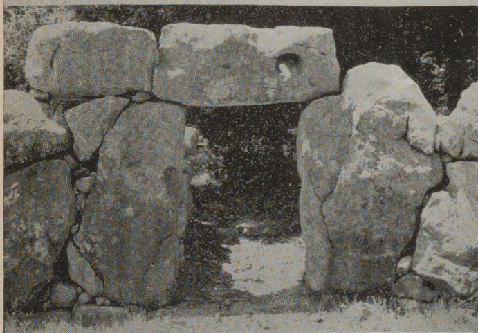
1. — Aspecto particular de las últimas excavaciones hechas en el poblado prehistórico de Ses Païsses de Artá.