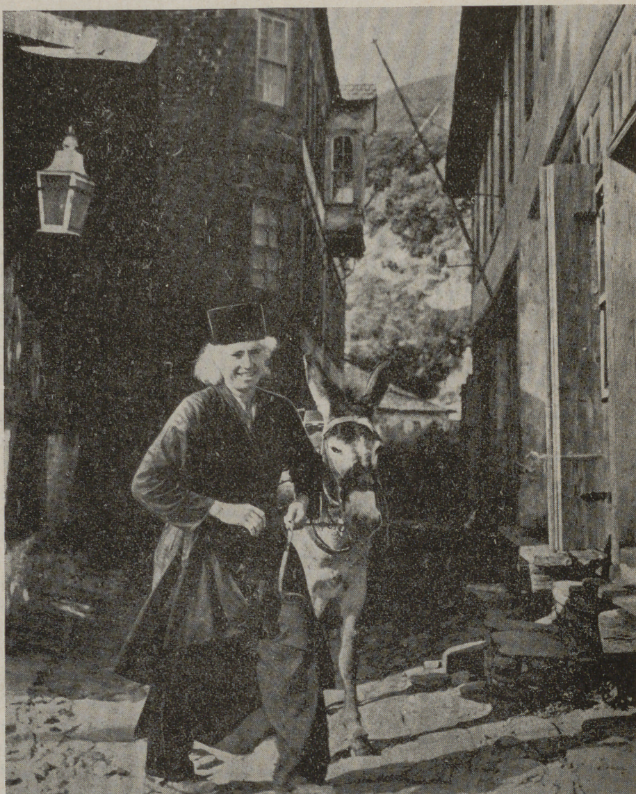
Un monje de Monte Athos con su burrito. En su rostro se trasparenta la alegría de su alma.

la letra. Mas no siempre habrán sido tan refractarios como ahora a las letras, pues en sus monasterios se conservan tesoros bibliográficos de incalculable valor, sumamente codiciados por escrituristas e investigadores. Sólo el monasterio de Vatopedi guarda cuatro mil códices, algunos importantísimos. El de Layra tiene dos mil y se calcula que en toda la Santa Montaña quedan en la actualidad unos once mil manuscritos, y esto sin contar los que han sido robados