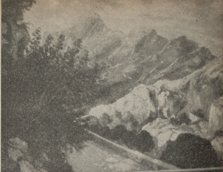
Una altra de les teles de N. Forteza

L'exposició ha estat molt ben acollida i comentada per la crítica i els cercles artístics.