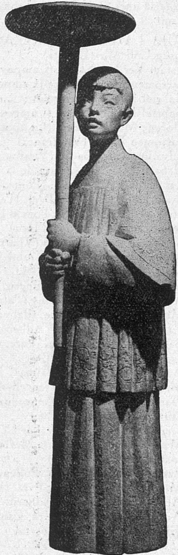
Una de les quatre estàtues en bronze del nou Cambril de Lluc, que l'Associació d'Antics Blauets es proposa costejar.