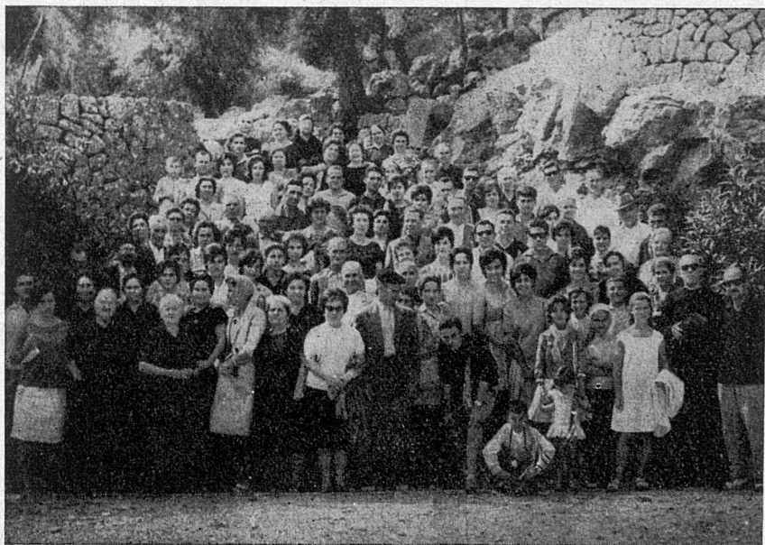
Peregrinació de Son Carrió

Dia 10. A les onze de la nit i amb una nombrosa concurrència de feligresos d'Escorca, ha tingut lloc una solemne Vigília de pregàries pel Concili Ecumènic Vaticà II