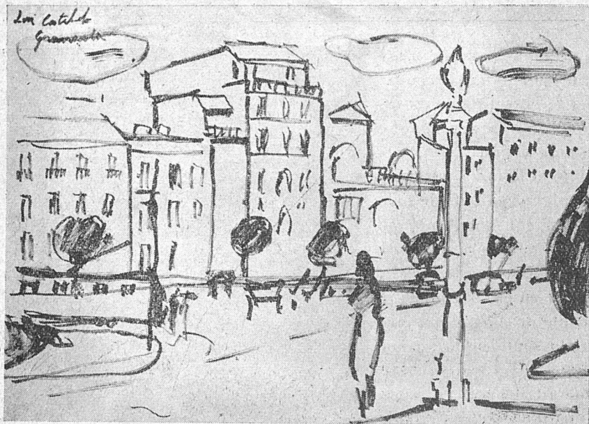
Dibuixos de Lluís Castaldo