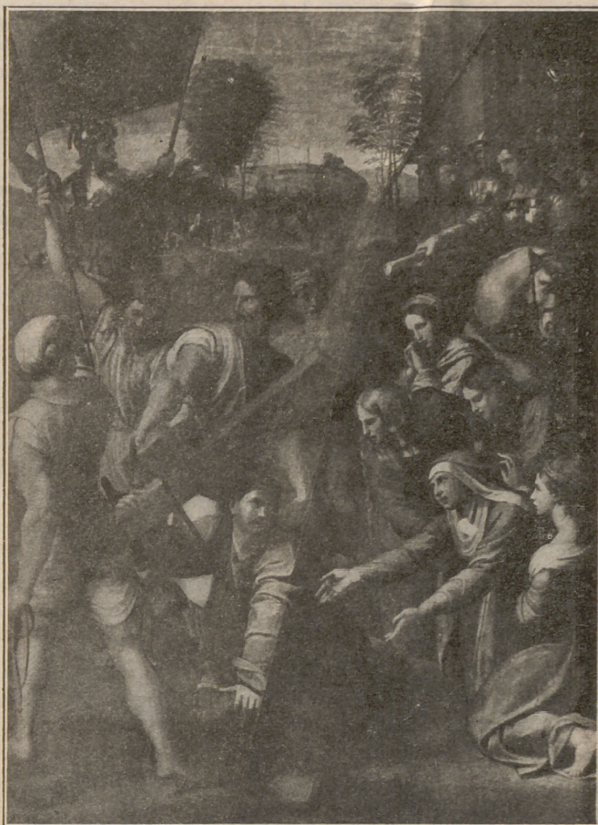
Caída de Jesucristo llevando la Cruz (Cuadro de Rafael)

te de su divino Maestro; y el corazón de los judíos se movía ciegamente de las más encontradas mociones, de triunfo y de abatimiento, de seguridad y de recelo.