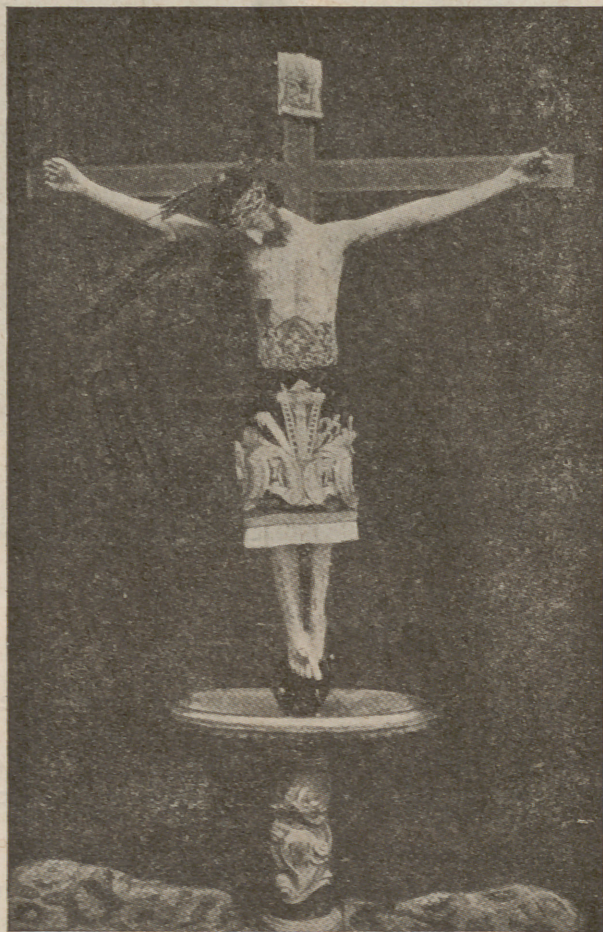
Imagen del Santo Cristo de la Sangre que se venera en la Iglesia del Hospital de Palma

Mientras tanto caminaban afanosas las devotas mujeres con su carga de perfumes y sólo les inquietaba este pensamiento que les repetía a cada paso su anhelante corazón: ¿Quién