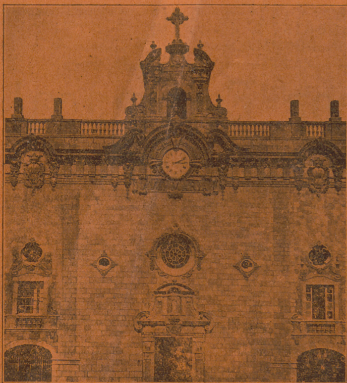
Nueva fachada del Santuario de Nuestra Señora de Lluç