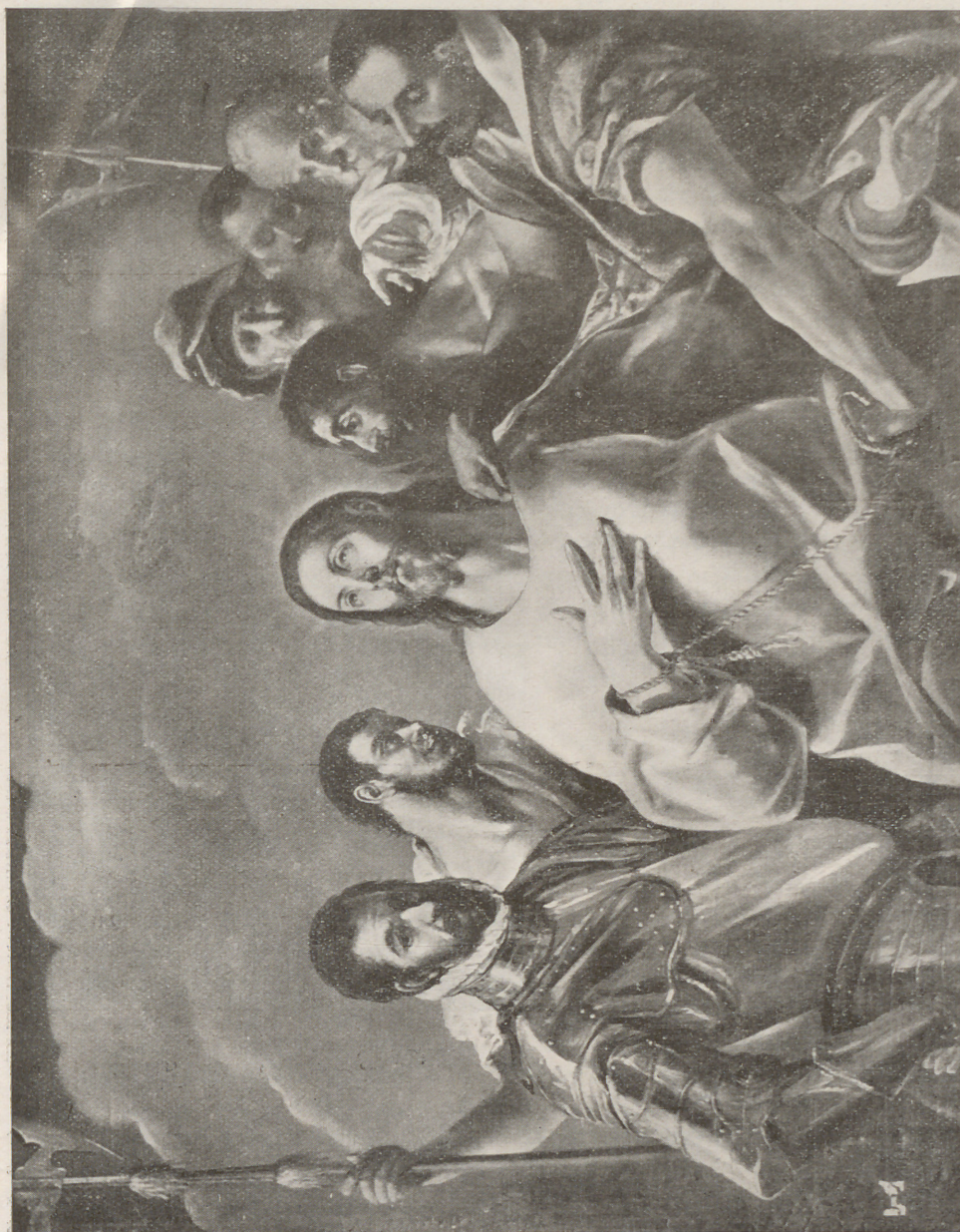
ESPOLIO DE CRISTO