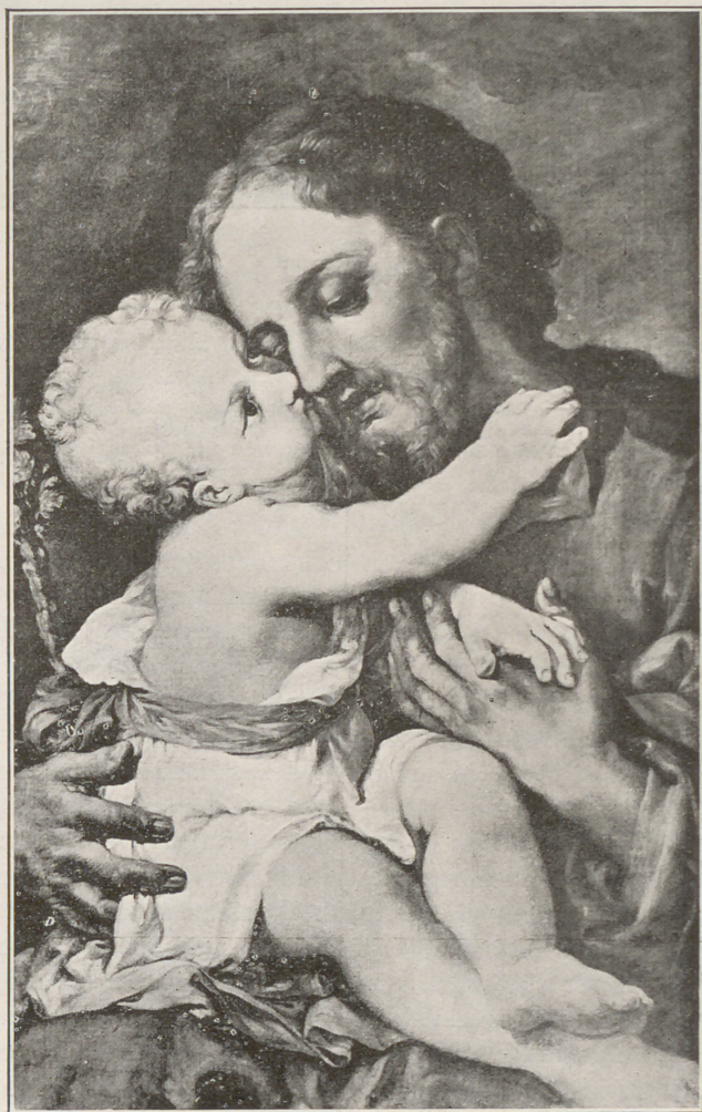
EL PATRIARCA SAN JOSÉ

afluencia más que regular de peregrinos en su último día, especialmente de Sa Pobla, casi mohino de no haber podido amedrentar con sus nieves y sus lluvias a los 740 peregrinos a que, durante su trascurso, dió albergue al Santuario.