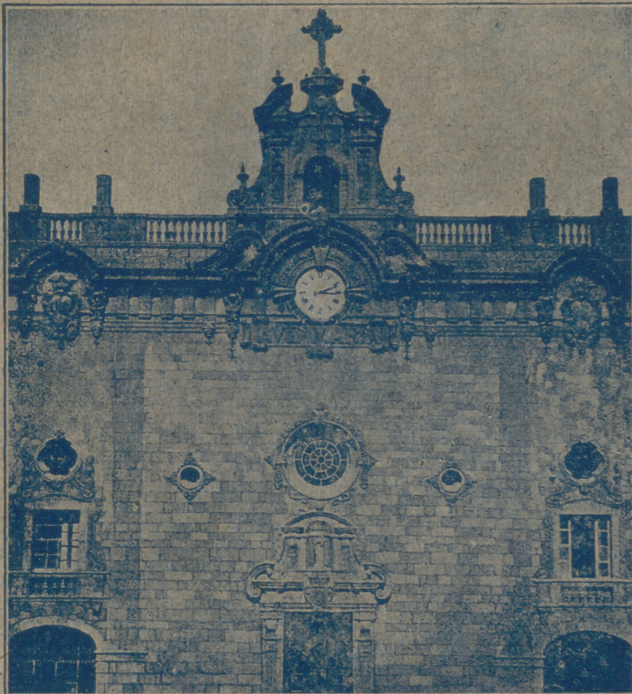
Nueva fachada del Santuario de Nuestra Señora de Lluç