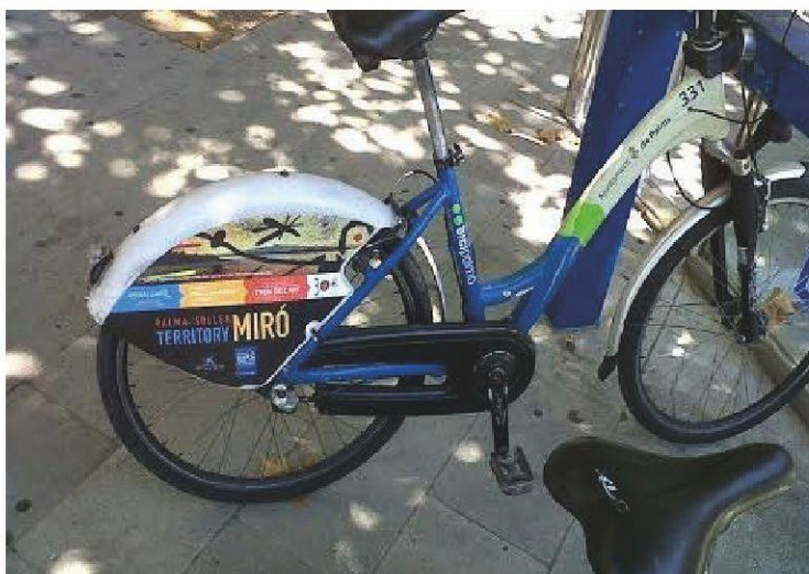
Ejemplo del vinilo situado en una bicicleta de Bicipalma.

La campaña contó con la impresión de 40.000 folletos informativos como los que podemos observar a continuación.