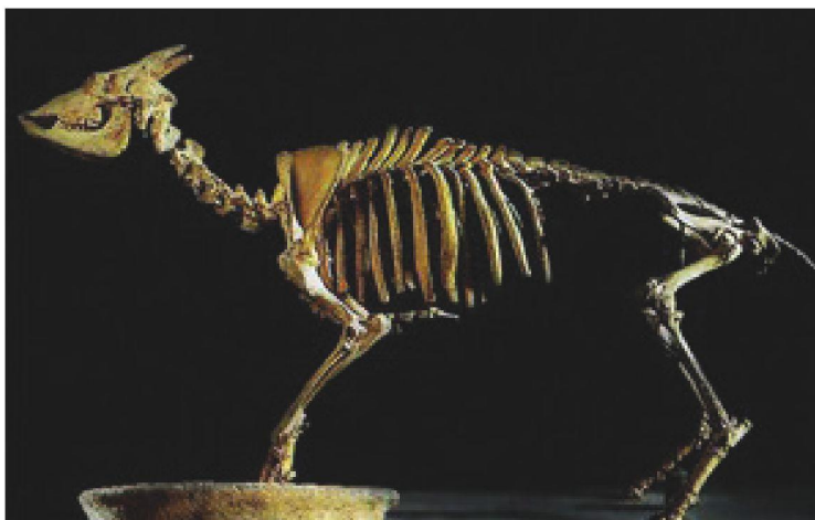
2. Museu Balear de Ciències Naturals.

Situades al Piémont de la Serra de Tramuntana, a la comarca del Raiguer de Mallorca, reben el nom