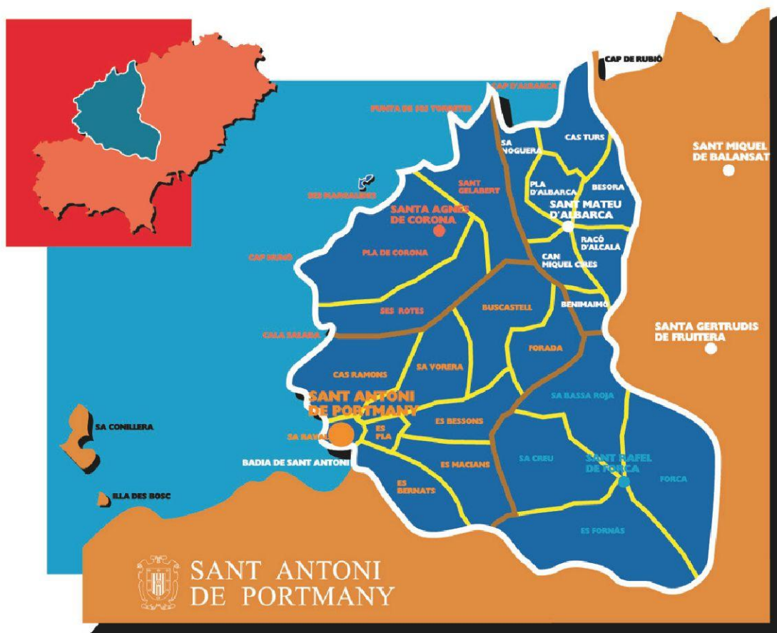
3. Mapa de Véndes de Sant Antoni. Consell d'Eivissa i Formentera.

niment de camins i ponts, aplegar els delmes, etc. Fins al segle XVIII Sant Antoni tenia dues grans véndes, la des Cap Blanc i la des Torrent. Va ser durant la primera meitat del segle XIX quan es varen establir les véndes actuals. Darrerament les véndes servien a l'església per organitzar la "salpassa", això és, la benedicció de les cases després de Pasqua. Ara mateix ens trobem a la vénda des Pla, que històricament havia tingut molt poques cases; ha estat durant el segle XX quan s'hi han construït més cases. Les altres véndes de Sant Antoni són: la de sa Raval, Cas Ramons, Sa Vorera. Buscastell i Forada, des Puig des Bessons, des Macians i des Bernats. Molts municipis d'Eivissa i Formentera han recuperat i oficialitzat la divisió territorial a base de véndes.