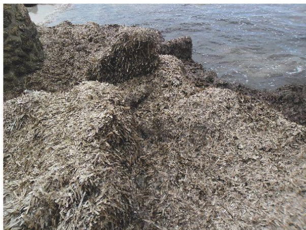
4. Posidònia a la platja des Pouet. Marià Torres.

amuntonada per tal que l'aigua de pluja la netegés de la sal que conté. La posidònia s'ha aprofitat com a material de construcció per a les teulades de les cases: damunt el tegell hi col·locaven una capa de posidònia, després altra capa de carbonell de sitja, i després una altra capa d'argila. La tiraven dins les basses dels corrals dels animals perquè juntament amb els excrements fessin adob per a la terra; altres vegades, sobretot a l'estiu, per donar frescor als animals i alhora el iode que conté i la sal servia d'antisèptic i prevenia les malalties dels animals. La sal que podien llepar els animals de preu com mules, cavalls i egües era un energètic molt important per al manteniment d'aquests animals. I encara la sal que treien de la posidònia era molt necessària per a la producció de la llet de les cabres i ovelles. També era aprofitada per fer un llit per a planter de certes hortalisses i fins i tot a una terra molt eixuta es tirava al fons del clot fet per sembrar parres, o fins i tot melons i xindries, mesclant la posidònia i amb figuera d'indi a vegades amb males herbes com la botja, de manera que fes humitat per treure arrel la planta i poder començar a créixer.