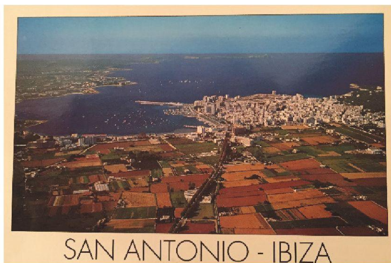
2. Foto d'una postal de COFIBA. Distribucions S.A. Palma. 1987

La Guerra Civil va interrompre aquest creixement turístic, que no va ser recuperat fins al anys quaranta i cinquanta. A partir d'aquesta data es va produir el boom de la construcció d'establiments turístics, tant dins el poble com a l'entorn de la badia. Obren portes nombrosos restaurants, moltes sales de festa, així com bars i botigues, que ofereixen tota una sèrie de serveis complementaris als turistes.