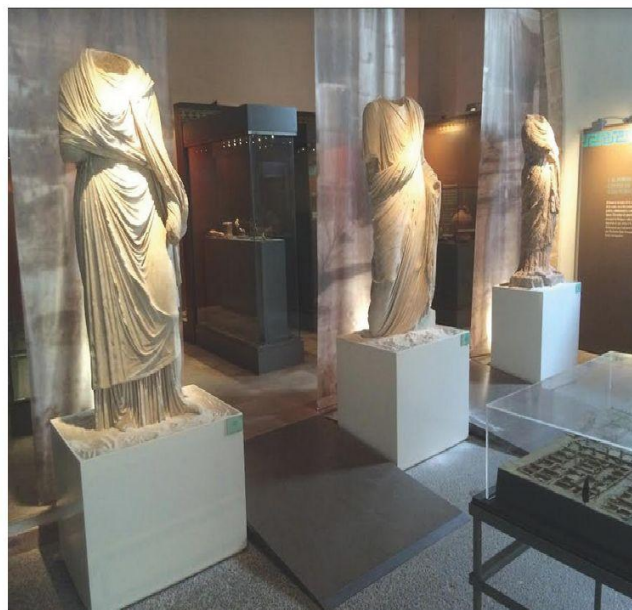
Escultures de marbre trobades a Pol·lèntia.

El museu és una secció del Museu de Mallorca. S'ha de destacar que està situat a l'Antic Hospital del municipi durant el segle XIV. Al museu hi trobem peces procedents de diferents campanyes d'excavacions. Hi destaquen tres escultures de marbre trobades a l'àrea del fòrum.