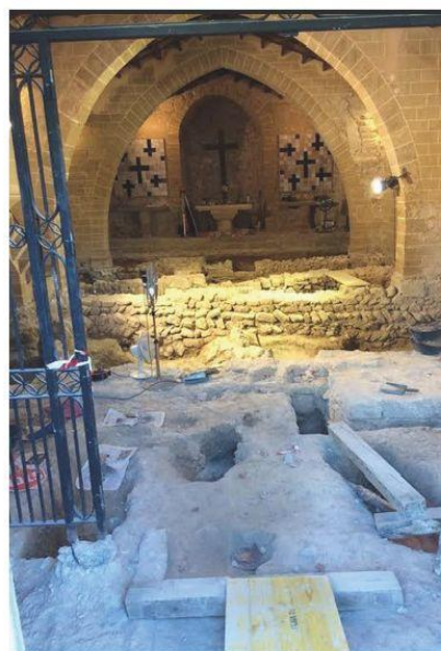
Excavacions a l'església de Santa Anna.

Solen tenir, com és el cas també de la de Santa Anna nau únic de planta rectangular, presbiteri pla i coberta construïda per un embigat de fusta de doble vessant, sostingut per una sèrie d'arcs. Es tractava d'una tipologia constructiva senzilla, econòmica i pràctica, que té la seva arrel en els esquemes constructius de l'ordre del Císter català. A Mallorca en trobem a altres municipis, com a Castelletx (Algaida), Sant Miquel de Campanet o La Sang de Muro.