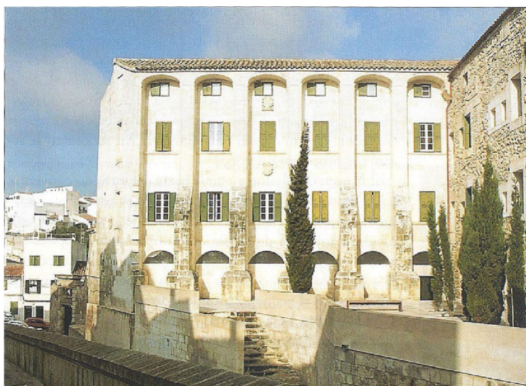
Museu de Menorca

És la institució amb un fons més ampli i amb un horari més prolongat, ja que obre de dimarts a diumenge. En temporada d'estiu —d'abril a octubre— el seu horari de dimarts a dissabte s'amplia als capvespres. L'entrada és gratuïta. Tot i que la part principal del museu és la dedicada a l'arqueologia, també té un bon fons de pintures, mapes i altres peces de l'edat contemporània. Disposa de plana web.