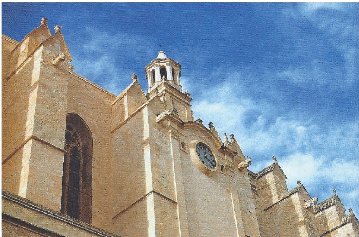
Catedral de Menorca

Al mig del port hom troba l'Illa del Rei, a la qual hi ha l'hospital militar que van aixecar els anglesos durant la primera dominació de l'illa (1708-1756). L'edifici, propietat de l'Ajuntament, va caure en un abandonament i ruïna totals fins que un grup de voluntaris va assumir la seva rehabilitació i posta en funcionament l'any 2004. Actualment la part principal de l'edi-