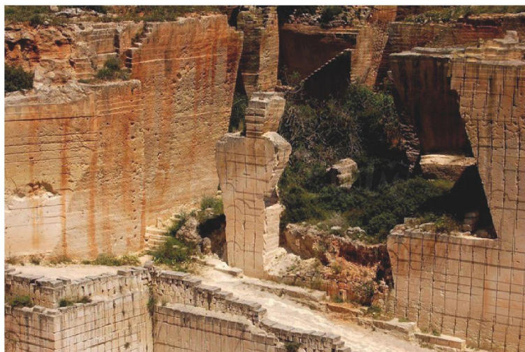
Catedral de Menorca

fici està restaurat. A l'interior hi ha col·leccions diverses, la majoria de temàtica mèdica. Des del 2014 es pot visitar els diumenges pagant una petita entrada i és possible que els propers anys s'ampliïn els dies de visita. Compta amb una plana web amb uns continguts adients.