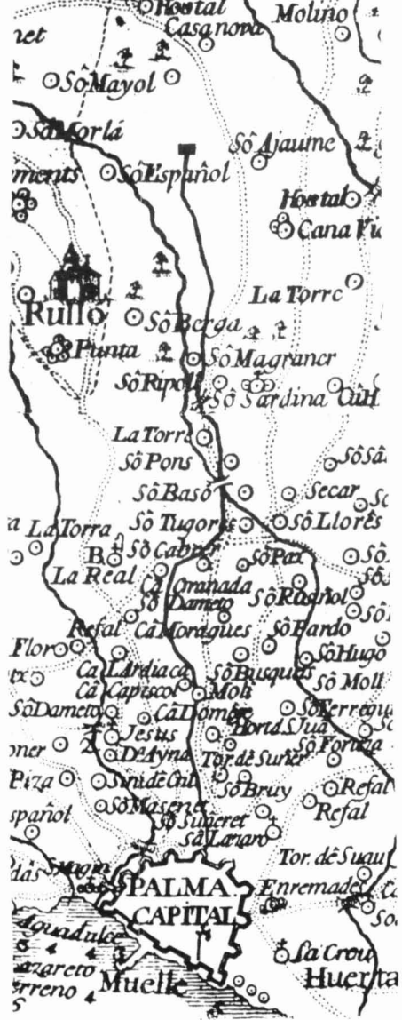
La siquia de l'aigua al carrer de Sant Miquel, segons el plànol de Palma d'Antoni Garau (1644).