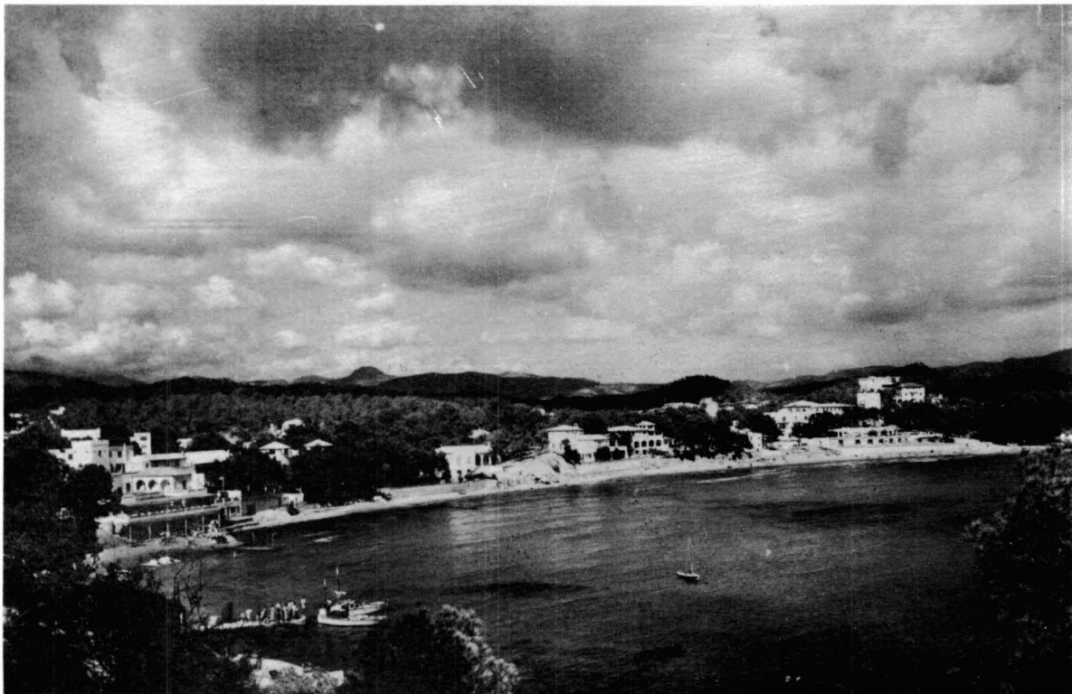
Imatge retrospectiva de Peguera (Calvià), avui un dels nuclis turístics amb més entitat de tota Mallorca.

Els terratinents, a la vegada que dominaven