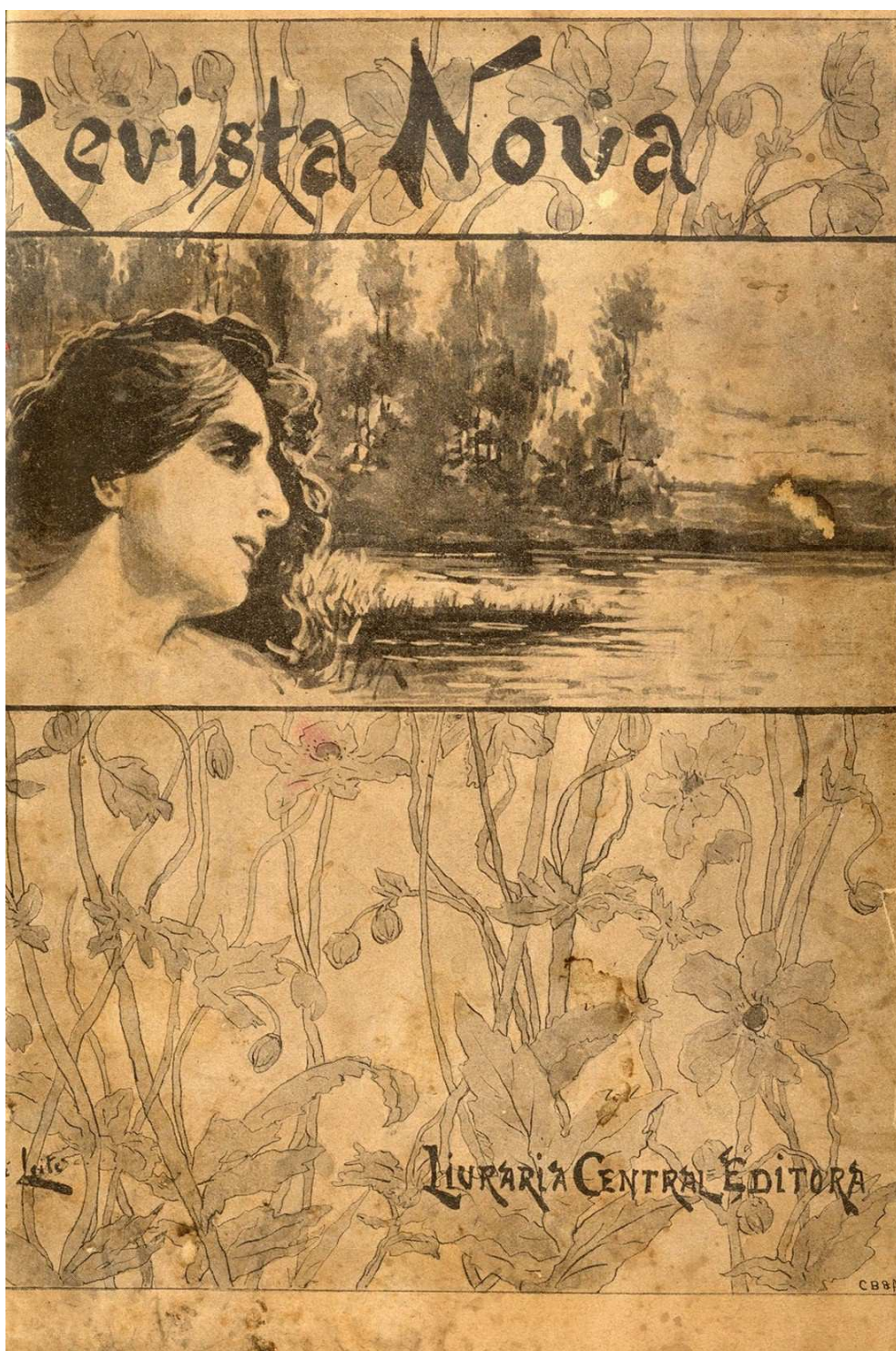
DOCUMENTO Nº13 Revista Nova , 1901, Lisboa.

In: http://hemerotecadigital.cm-lisboa.pt/Periodicos/RevistaNova/RevistaNova.htm