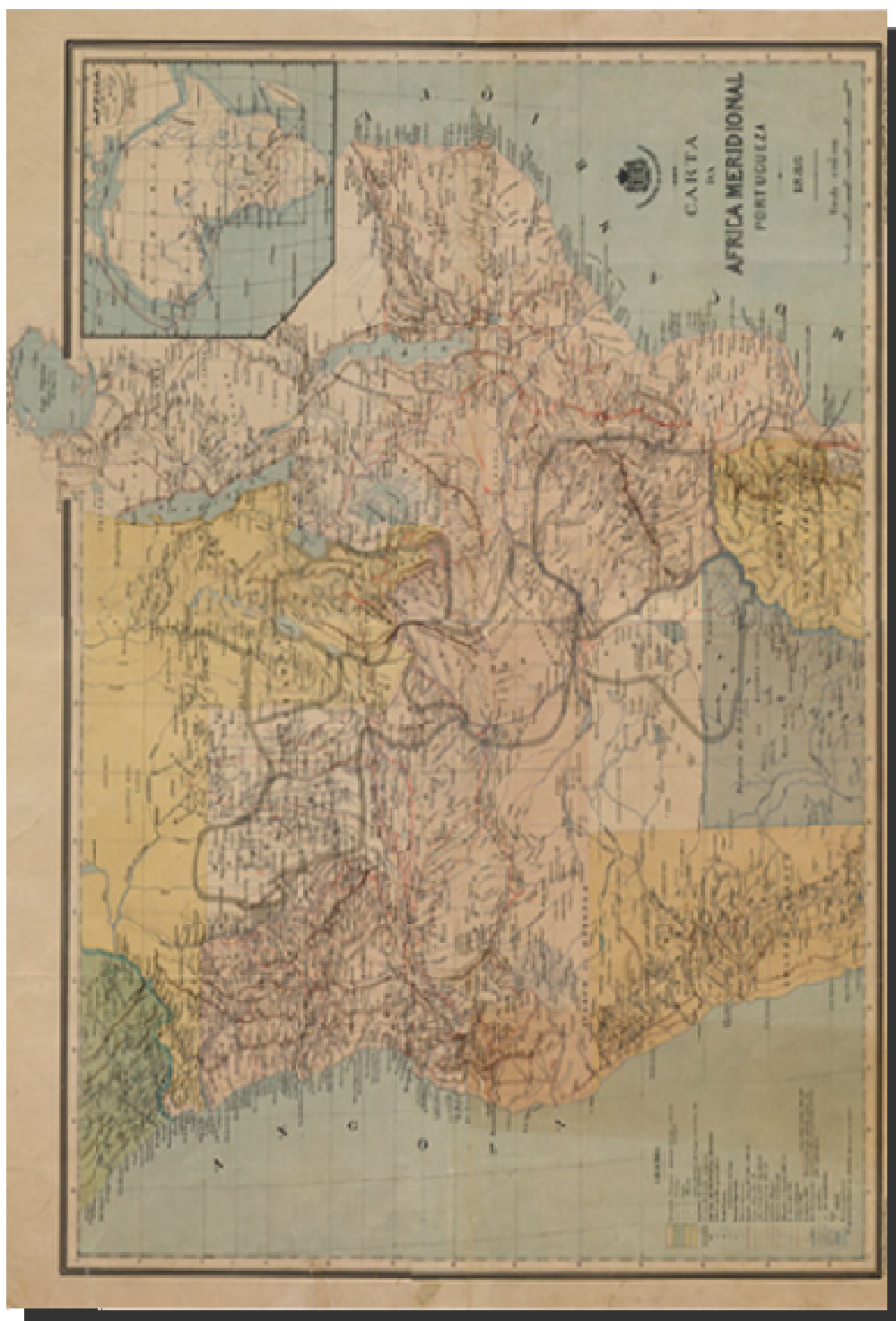
DOCUMENTO Nº 1 O mapa cor-de rosa