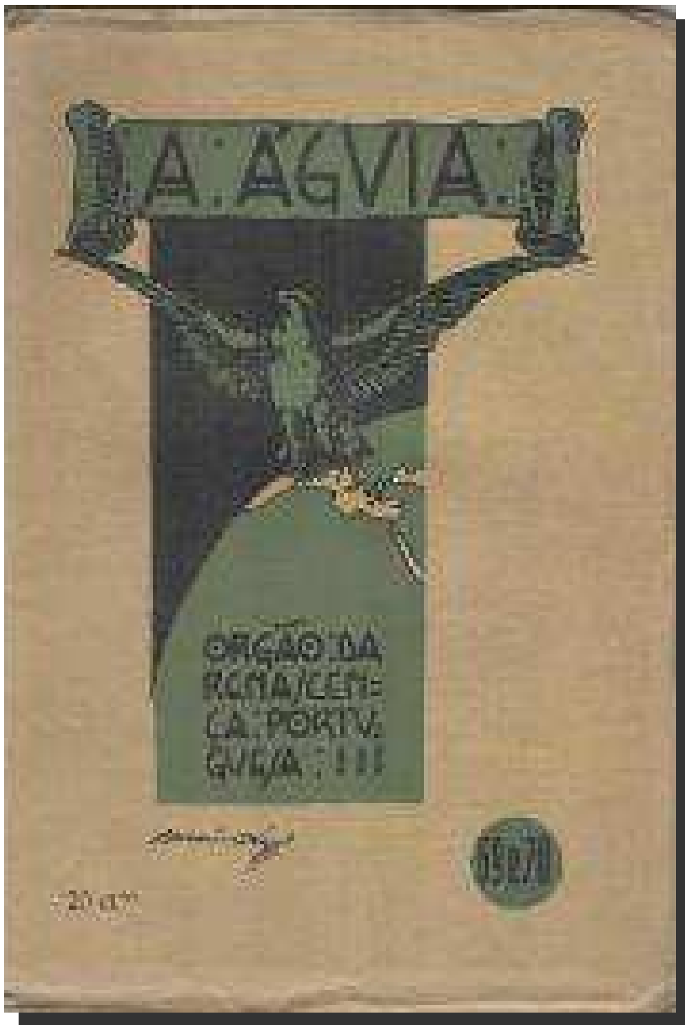
DOCUMENTO Nº12 Capa da Revista A Água, Porto, 1910.