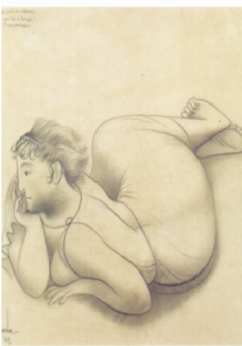
DOCUMENTO Nº3 Desenho a lápis de Almada Negreiros

A Europa jaz posta nos cotovelos O rosto com que fita é Portugal Fernando Pessoa