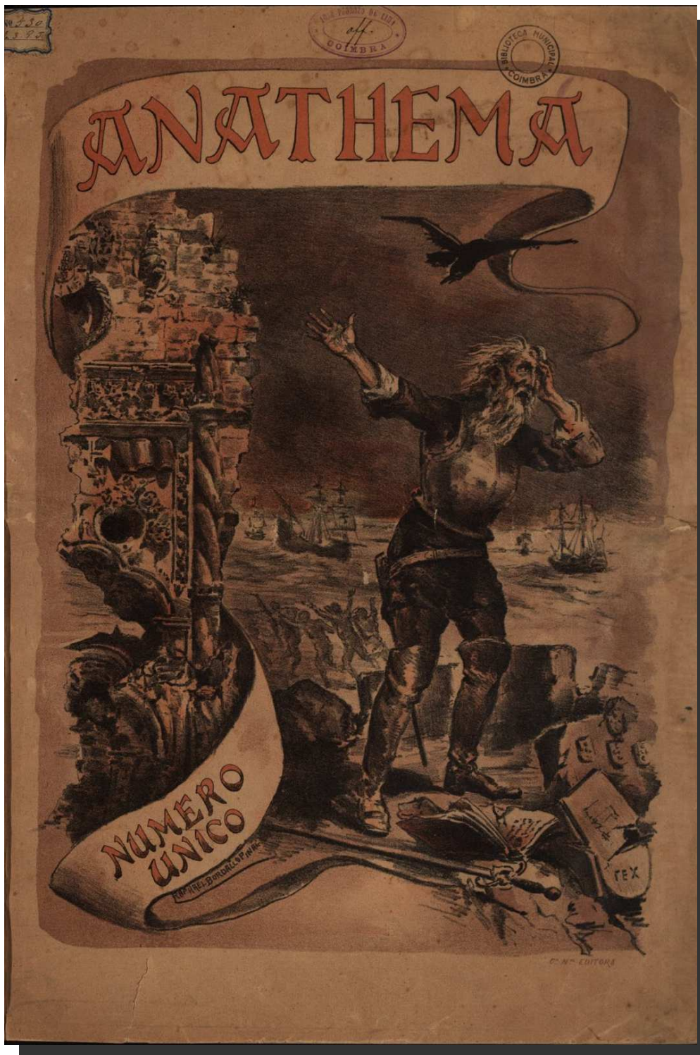
DOCUMENTO Nº11 Anathema , Coimbra, 1890