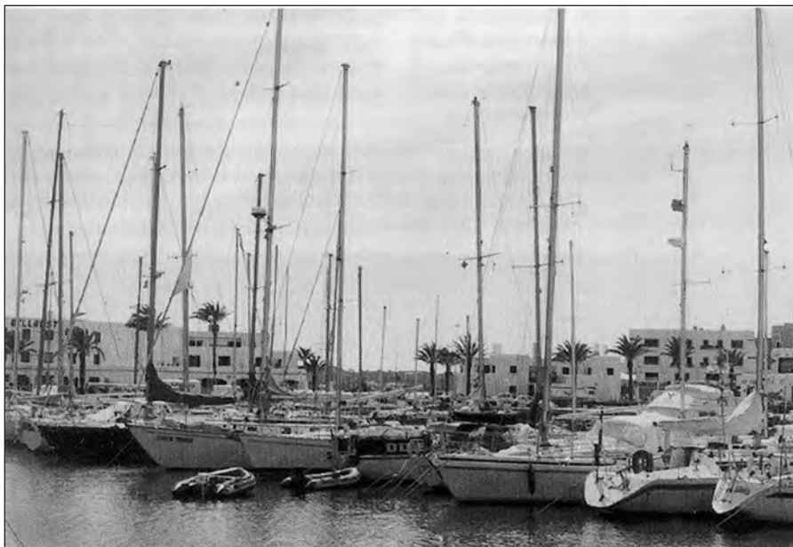
Fig. 6. I arriba el turisme..., la novíssima Formentera. Al peu de la Mola, la urbanització Maryland (dalt) ofereix un marc bucòlic per al descans. Més recentment, la demanda d'un turisme nàutic ha convertit la Savina (baix) en un port bàsicament esportiu i comercial, substituint la tradicional funció d'embarcador de la sal.

XVIII fins a mitjan de la centúria actual. La contraposem a la Formentera d'avui dia, que es configura i es desenvolupa des del sisè decenni del segle XX. Aquesta última és l'única Formentera que han conegut un bon nombre de formenterers actuals, tots aquells que no