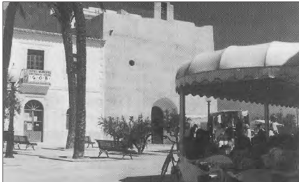
Fig. 4. La nova Formentera . El gravat de l'arxiduc Lluís Salvador d'Àustria ( dalt ) mostra la capçalera municipal cap al 1867; entre quatre casetes destaca l'església fortificada dedicada a Sant Francesc Xavier, i assenyalen en primer pla el sòl rocós, de crosta calcària. Llavors Formentera era poblada per unes 1.700 persones. Actualment, el cens de 1991 dona 4.760 habitants de fet per a tota l'illa, dels quals 466 viuen concentrats a Sant Francesc, que presenta característiques d'un nucli urbanitzat ( baix ).

del sud-est de la península Ibèrica, com nosaltres mateixos ho vàrem assenyalar, ja fa anys, tot presentant-lo com l'àrea climàtica menys plujosa de les tres grans penínsules euromediterrànies.