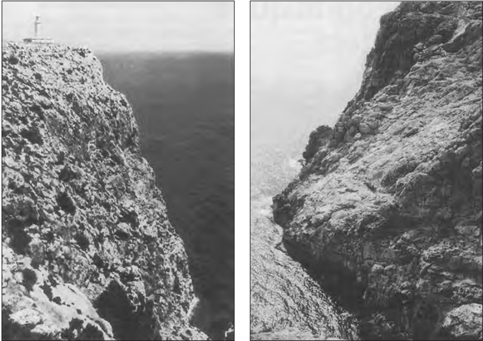
Fig. 2. Els penya-segats . L'altiplà de la Mola, a l'est, cau vertical sobre el mar en uns penya-segats de salvatge bellesa (esquerra); a l'oest, la sua inclinació vers el nord del pla del Rei dona lloc, pel sud, als espadats del cap de Barbaria (dreta).

L'altra, la més petita, la nostra Formentera, resta com la més meridional de les diverses unitats de l'Arxipèlag, apuntant vers el sud i el sud-oest. Barbaria no queda pas molt lluny, en efecte, del cap que porta el seu nom.