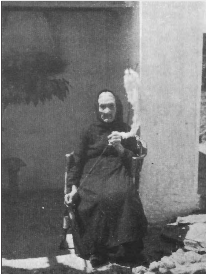
Fig. 5. Els horitzons tradicionals de treball. La gent de Formentera ha sabut explotar totes les possibilitats que el medi li oferia: la terra, el bosc i la infinita mar. L'activitat començava a la infantesa i es mantenia al llarg de tota la vida; i si bé el treball saliner era cosa d'homes (dalt), la velleta quasi centenària mentrestant filava la llana (baix).