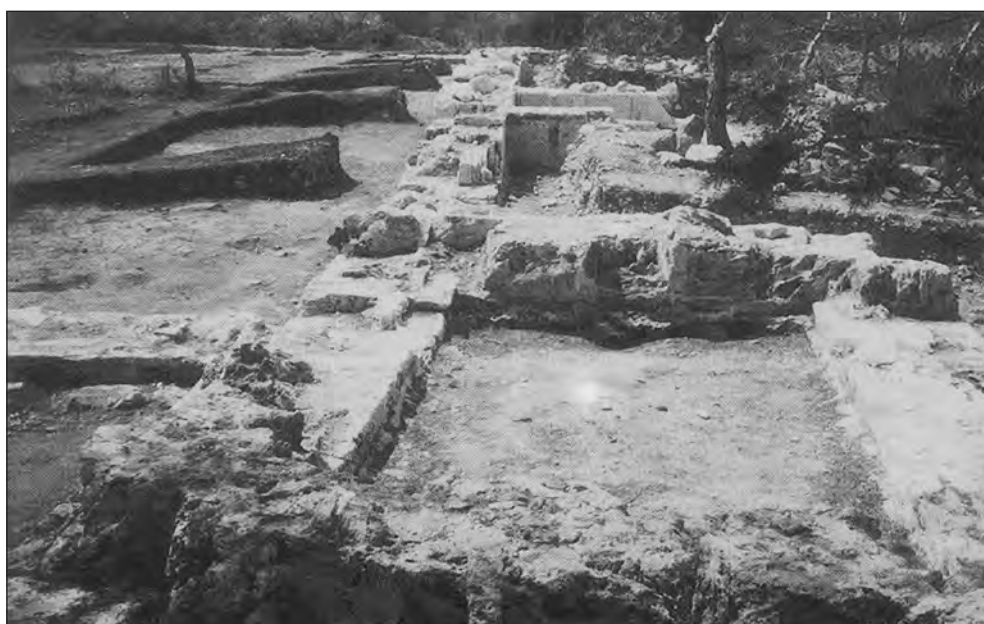
Fig. 3. El poblament històric. El monument megalític de ca na Costa (dalt), construcció funerària d'època pretalaiòtica, és testimoni d'un poblament prehistòric de l'edat del bronze, que es remunta a la primera meitat del segon mil·lenni abans de Crist. Situat al tómbolo central, el castellum romà de Can Pins (baix), del baix imperi, mostra una Formentera que feia ja d'avançada en el sistema de protecció d'Eivissa.

Amb el que acabem de dir, Formentera es defineix com la més àrida de les illes de l'Arxipèlag. Amb aquesta perspectiva, de fet, constitueix una prolongació del domini climàtic