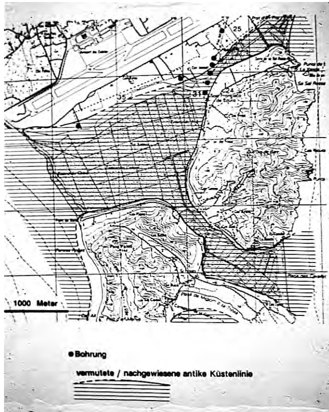
2. Prospección geo-arqueológica de la zona de ses Salines. Las líneas discontinuas corresponderían a la supuesta antigua línea de costa (De H.D.SCHULTZ, G. MAASS-LINDEMANN: Prospecciones geo-arqueológicas en las costas de Ibiza, Eivissa , 1997.

A comienzos del siglo VI a.C. empieza un proceso de urbanización estable en el puig de Vila (Eivissa), comparable a otros centros del Mediterráneo (Gadir, Malaka o Cartago), y con unos rasgos propios: