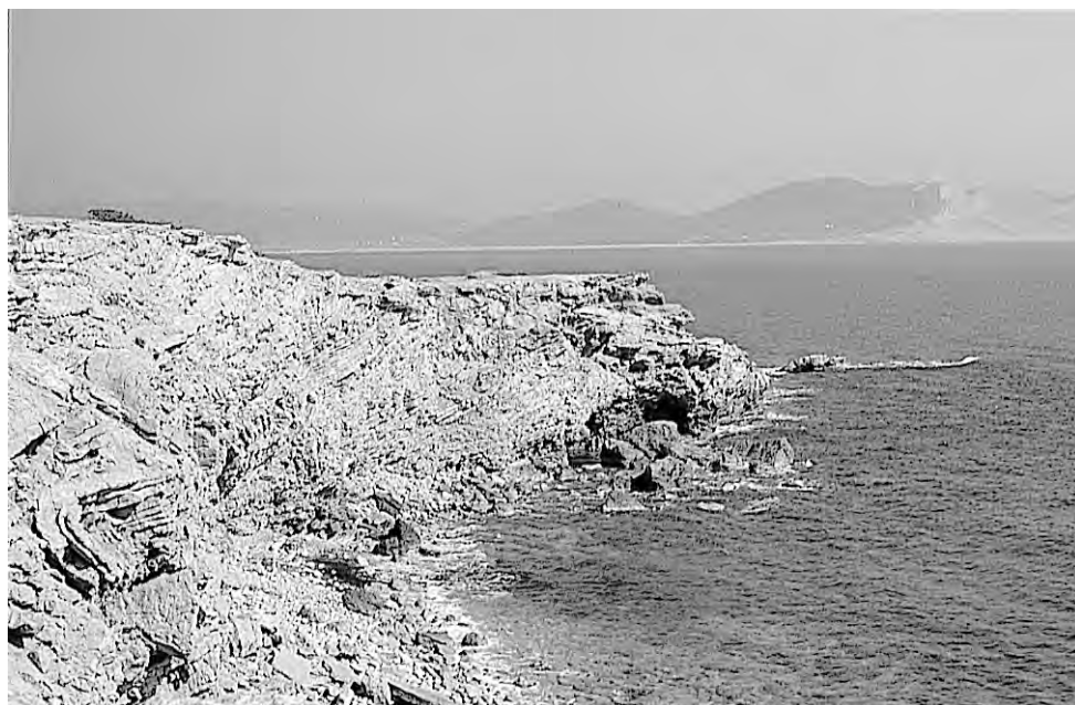
4. Emplazamiento del yacimiento fenicio de sa Caleta, asentado sobre una península formando el típico paisaje colonial inicial.

El desarrollo « empresarial » comportó el cierre de algunas salinas, como la de Ostia, donde la calidad de la sal había disminuido en relación con otras del Mediterráneo, en las que la sal extraída era mejor para llevar a cabo otras actividades, como la fabricación del garum —en la Edad Media la sal de Eivissa era considerada muy buena debido a la retención de la humedad permitiendo una mayor conservación de los productos—. Esto conllevó también unos cambios técnicos para poder transportar los productos secundarios. Las ánforas Mañá C2a eran más ligeras y tenían una forma cilíndrica más apta para el transporte marítimo y más sencilla de fabricar. La boca exvasada de este tipo anfórico permitió verter a otros recipientes las nuevas variedades semifluidas de la salazón fabricada en las factorías. Estas ánforas se distribuyeron por todo el Mediterráneo Centro Occidental, desde finales del siglo III a.C. hasta la época augústea (LÓPEZ CASTRO, 1995, 118-119).