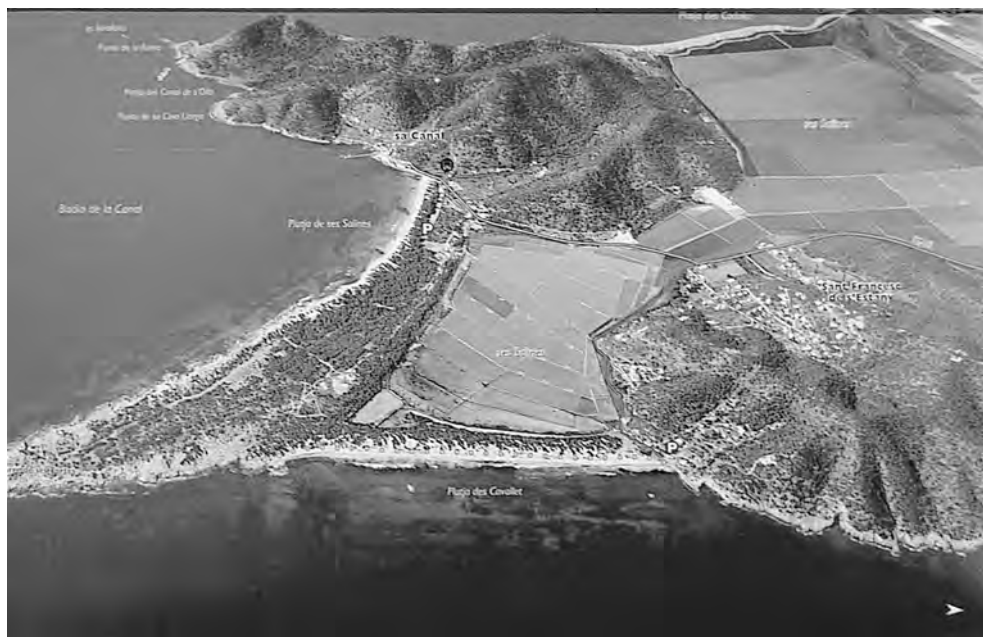
3. Panorámica de ses Salines d'Eivissa con una superficie próxima a las 500 hectáreas, ocupan una antigua área de marisma litoral, que ya se hallaba parcialmente transformada en la Antigüedad.

El patrón de asentamiento constituyó un nuevo planteamiento para la explotación del territorio y a la vez mantuvo una jerarquización entre las unidades de hábitat. De tal modo, que el único centro urbano concentró la actividad comercial e industrial a nivel insular; así como el gobierno y la administración.