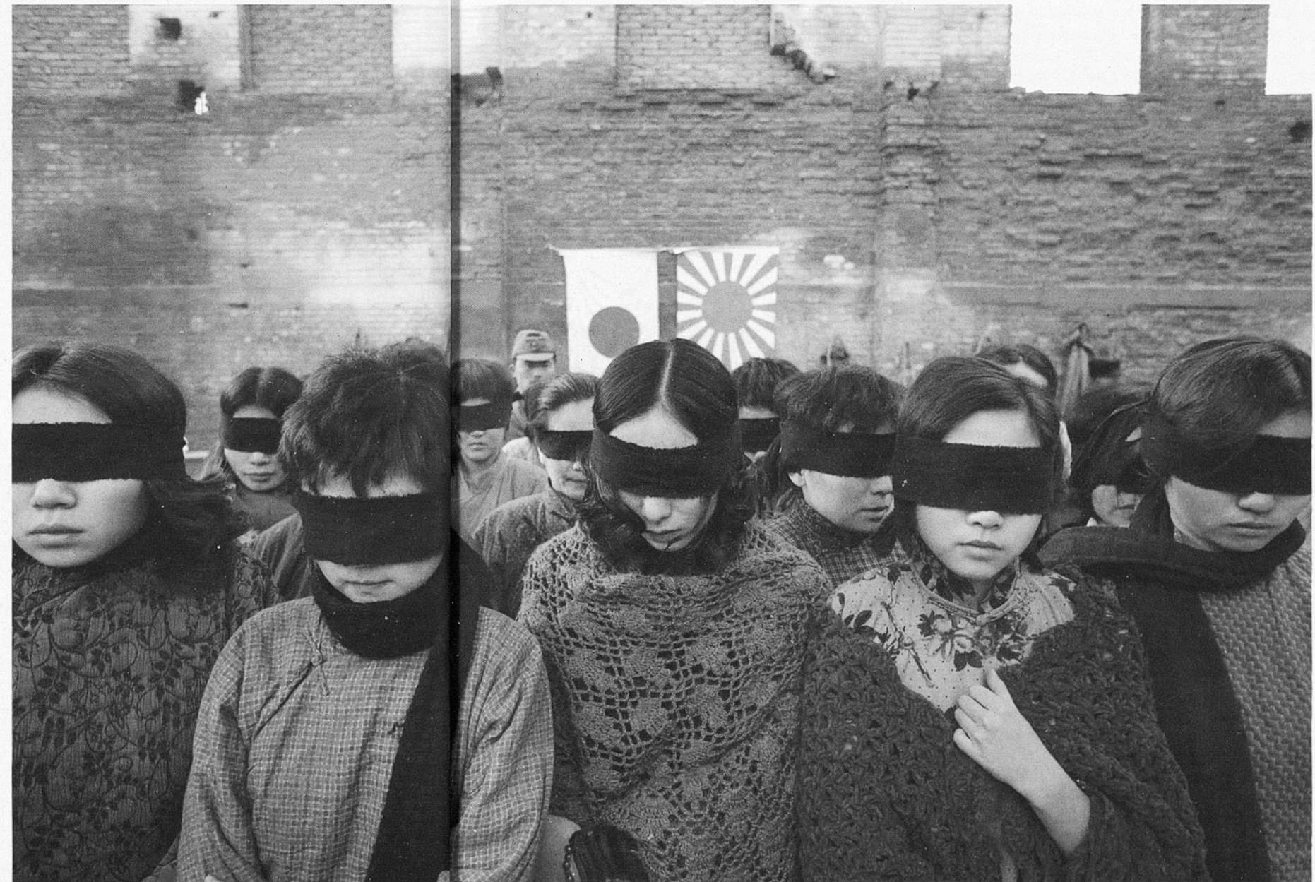
City of Life and Death

Amb una llum menor, però dignes també de figurar en aquest apartat de l'article, es troben Blessed i Yo, también . La primera és de la realitzadora australiana Ana Kokkinos i ens hi mostra un retrat parcial dels problemes que genera la manca de comunicació entre pares (millor hauríem de dir mares)