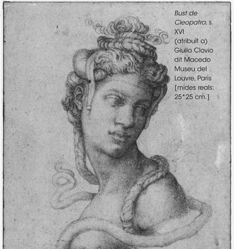
Bust de Cleopatra , s. XVI (atribuït a) Giulio Clovio dit Macedo Museu del Louvre, Paris [mides reals: 25 x 25 cm.]