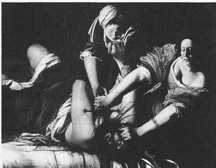
Judit i Holofernes, 1620-30 Artemisia Gentileschi Capodimonte, Nàpols [Mides reals: 168*128 cm

«Ja feia tres anys i quatre mesos que Judit vivia a casa seva, viuda. S'havia fet com una mena de cabana sobre el terrat de casa seva; s'havia posat un sac als lloms i portava tothora el vestit de dol. D'ençà de la seva viduïtat que dejunava cada dia, fora de les vigílies dels dissabtes, els dissabtes, les vigílies de les llunes noves, les llunes noves i els dies de festa o d'alegria de la casa d'Israel. El seu rostre era bell i tot el seu aspecte molt agraciat. Manasés, el seu marit, li deixà or i plata, esclaus i esclaves, ramats i camps; i ella se n'ocupava. I no hi havia ningú que digués cap mal d'ella, perquè tenia un gran