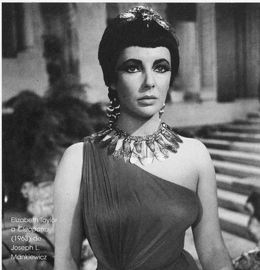
Elizabeth Taylor a Cleopatra (1963) de Joseph L. Mankiewicz

La idea o concepció moderna que tenim de Cleopatra no s'ajustaria amb una imatge de dona pàl·lida amb una llarga cabellera vermella sinó tot el contrari. De fet, ella formaria part d'aquest grup de dones "maleïdes" més aviat per l'aspecte psicològic o d'actitud tal i com es veu en la pel·lícula de Joseph L. Mankiewicz protagonitzada per Elizabeth Taylor ( Cleopatra , 1963). Però el que sí que hem de destacar de l'aspecte físic de Cleopatra no és solament la innegable bellesa que l'imaginari col·lectiu li ha atorgat sinó la introducció d'un aspecte de