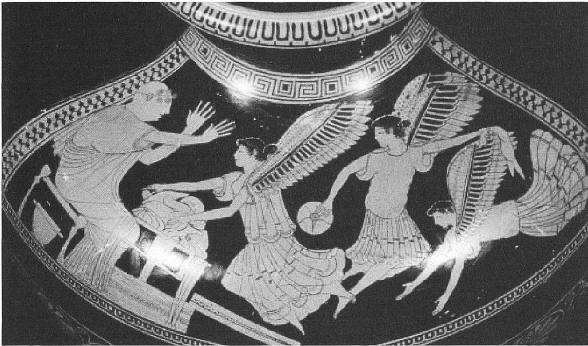
[ARPIES], Vas àtic, aprox. 480 a.C. (Museu Paul Getty)