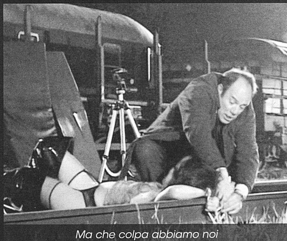
Ma che colpa abbiamo noi

Carlo Verdone. Ma che colpa abbiamo noi (2003), 89 min.