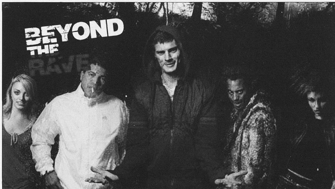
El retorn de la Hammer: Beyond the Rave

P. I qualque director emblemàtic, qualque gènere?