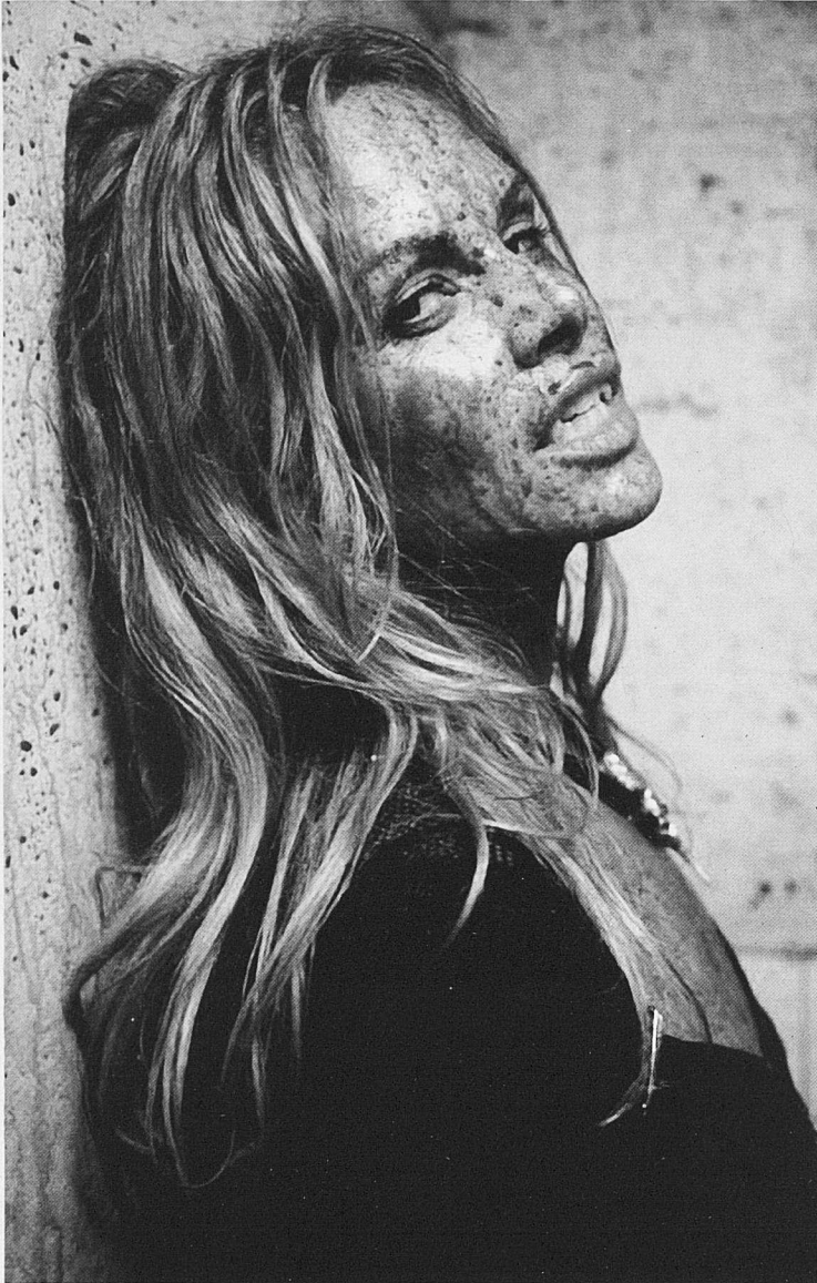
Hammer Girl revisited

P. En relació amb la direcció, podem esmentar els curtmetratges següents: Rhythm , 2002, super-16; Cup of Tea , 2003, super-16; Tube Starter , 2004, vídeo digital; Bum Starter , 2004, vídeo digital; Sometimes , 2004, super-16; Lonely Hearts , 2007, super-16; Help. There Is a Man In My Bed , 2007, alta definició.