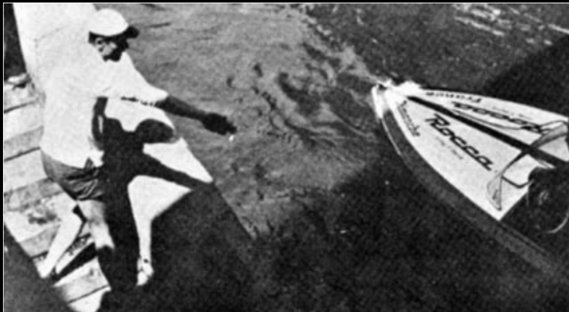
La carrière de Suzanne

En aquests treballs, ja col·laboren amb Rohmer noms com Godard o Jacques Rivette, tant d'actors protagonistes, productors o directors de fotografia. Abans que acabin els anys cinquanta, Rohmer es convertirà en redactor en cap de Cahiers du Cinéma , escriurà conjuntament amb Claude Chabrol un llibre de referència sobre el cineasta Alfred Hitchcock i estrenarà la seva opera prima , Le signe du