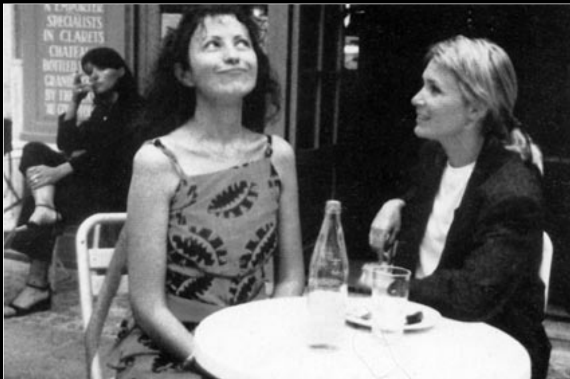
El rayo verde

1927). Als estudis i aproximacions a l'obra de Rohmer, és quasi obligada fer referència a l'obra i figura de Murnau com una de les influències més notables sobre el seu cinema, ja que, entre d'altres aspectes presents a les pel·lícules, la tesi doctoral del cineasta francès era una anàlisi de la utilització de l'espai al film Faust - Eine deutsche Volkssage ( Fausto , 1926), del director alemany, 9 un factor que demostra d'una forma cristal·lina l'interès personal de Rohmer pel cineasta nascut a Bielefeld l'any 1888.