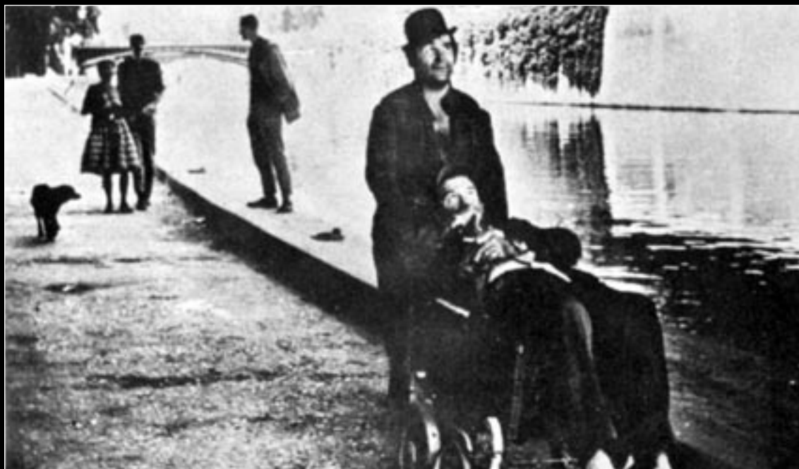
Le signe du lion

(16) Director de fotografia barcelonés, nascut al 1930, i un dels referents del cinema espanyol en aquest camp. Va treballar amb Rohmer en diferents etapes des de 1964, i aquest film va ser la seva darrera col·laboració.