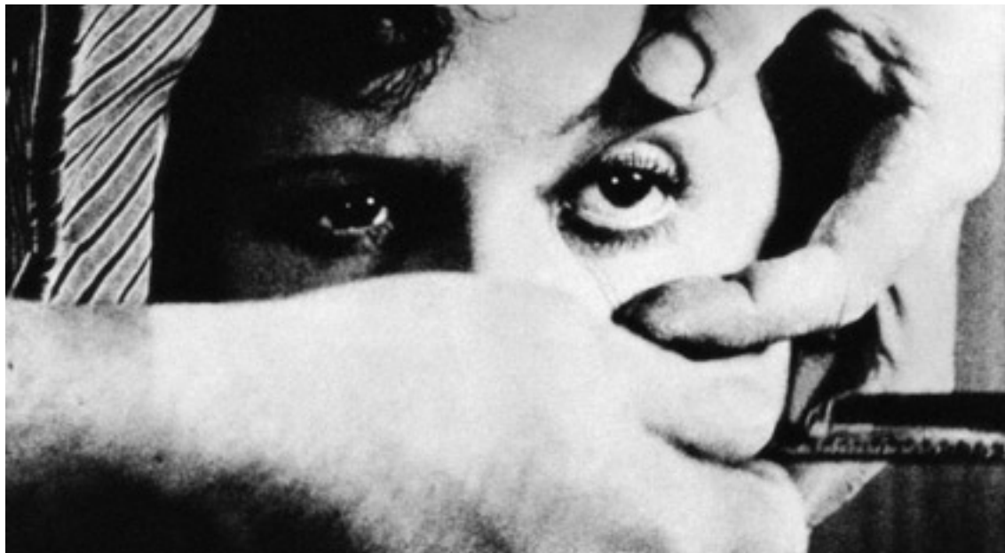
Un chien andalou

Per això, per si ens hem d'empassar pel·lícules massa dolentes a competició, tenim una meravellosa retrospectiva sobre Luis Buñuel i una altra de Francesco Rosi, qui rebrà el premi honorífic d'aquesta edició. Un chien andalou (1929), l'ull de vaca tallat del surrealista parisenc, es presentarà quatre vegades seguides al teatre Volksbühne amb quatre músiques contemporànies diferents. ¿Per què, si Buñuel no hi va posar cap música? És igual, la qüestió és veure i tornar a veure Buñuels, amb o sense músiques. La retrospectiva projectarà 32 pel·lícules del mestre aragonès, algunes d'elles en versió restaurada. ¡Que bé, Buñuel! Si ens hem d'empassar Guantánamos i coses de consciència social, sempre tndrem el consol del mestre. ■