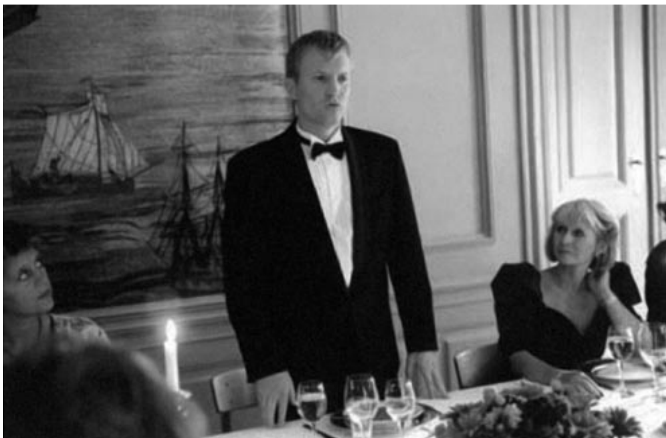
Celebración ( Festen 1998), de Thomas Vinterberg

enfront dels conflictes personals, socials a vegades, i que passen sovint en l'interior de les cases, que són cases del benestar, amb mobles dignes i estances lluminoses, però que moltes vegades es converteixen en escenaris de tragèdies familiars, conflictes psicològics, o, fins i tot, presons. Igual que els mobles (arxi-coneguts per a tots nosaltres també), les ciutats són netes i estan ben organitzades, hi ha una aparent justícia i comoditat, però tot això no allibera la persona d'enfrontar-se a la pròpia existència, a plantejar-se els seus valors, a qüestionar el sentit dels seus actes, a acceptar les emocions com a cosa intrínseca a la seva naturalesa, en definitiva, a suportar el pes de la pròpia vida. La solitud, l'aïllament, la recerca de l'amor, el respecte per un mateix, la lluita quotidiana per la vida, són temes que es repeteixen per a uns personatges que pareixen infeliços en ciutats quasi-perfectes. La pregunta que pareix plantejar-se una i altra vegada és ¿per què no poden les persones ser felices en un entorn de cartró pedra?, ¿quines coses mereixen la pena en l'estat del benestar?, ¿és aquesta la gran mentida del capitalisme lluminós? De bell nou observam que no són tan diferents a nosaltres.