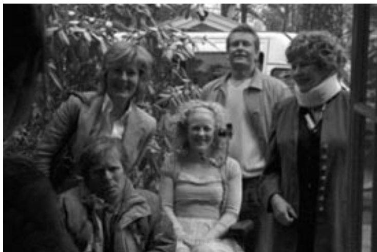
The art of negative thinking (2006), de Bard Breien