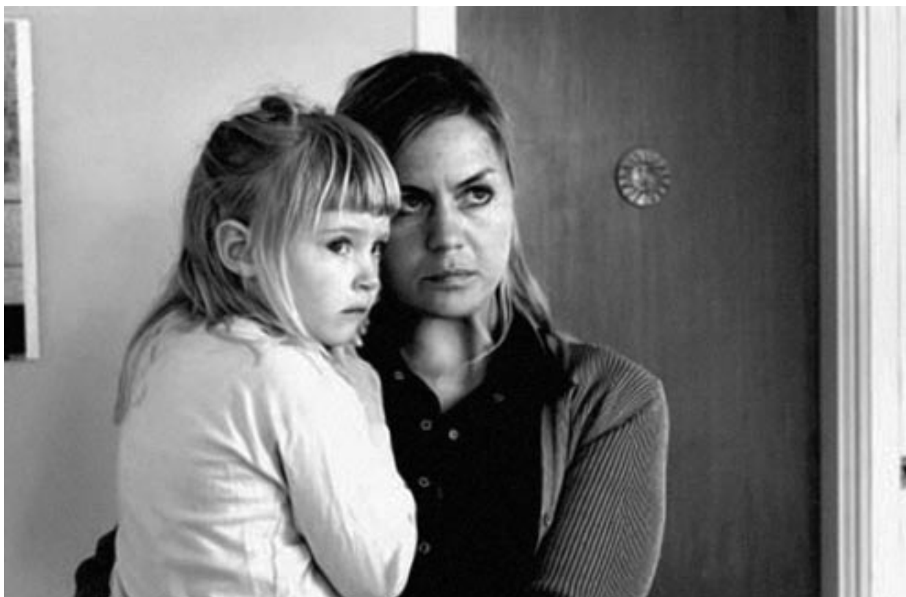
Children (2006), de Ragnar Bragason

cinemes de propietat municipal que encara és vigent. L'empresa productora més antiga del món, la Nordisk Film, es va fundar el 1906, i segueix mantenint el seu protagonisme en els països nòrdics.