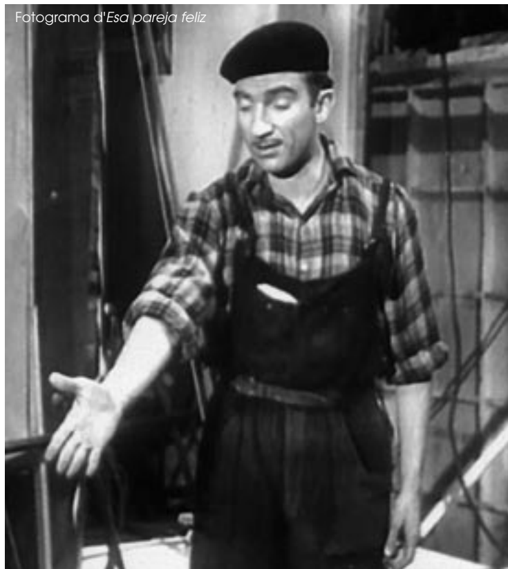
Fotograma d' Esa pareja feliz

Tardamos mucho tiempo, ya concluida y quizás exhibida la película, en enterarnos de que a los tres nos parecía inadecuado el vestuario. Nuestro mutuo respeto nos había hecho caer en la trampa. Creía yo que aquel vestuario era el que habían elegido ellos, y ellos creyeron que era el vestuario que había elegido yo para, como decíamos los actores, "componer el tipo", cuando en realidad no eran más que un montón de prendas dejadas en el camerino por el encargado de sastrería por si alguna podía ser útil en cualquier escena de la película." (Extracte de les memòries de FFG del llibre El tiempo amarillo ). ■