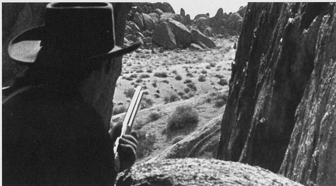
Fotograma de la pel·lícula

que va acceptar transportar-los, sense saber que ho eren, perquè necessitaven els honoraris pel viatge. Li mostra la caixa, davall el seient; i en aquell moment s'aixeca Scott, fent-li baixar la caixa i ordenant que se'n vagin a Califòrnia. Els lladres vendran a cercar els diners i ell els esperarà. Però el Sr. Greer, en lloc de Califòrnia, va a Flora Vista per donar part al xèrif que els diners són allà i que els lladres són Bordeen i el seu company. Quan els Greer hi arriben, surt a rebre'ls Bordeen i el seu company. Els demanen per la caixa; però ell contesta que la té Scott i baixa de la carreta per anar a donar part al xèrif. Quan Bordeen ho veu li pega dos trets per l'espatlla. Marvin i Clete ho observen i el primer comenta que s'havia equivocat amb Greer, que no era un mig home. Després, els dos supervivents del robatori van cap on és Scott per agafar la caixa, i Marvin i Clete surten darrere ells. (Continuarà) ■