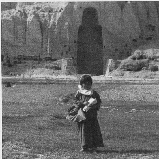
Buddha Collapsed Out of Shame

Pel que fa a moments històrics més allunyats, podem fer referència a Matar a todos i a Emotional Arithmetic (Aritmética Emocional) . Cap d'aquestes