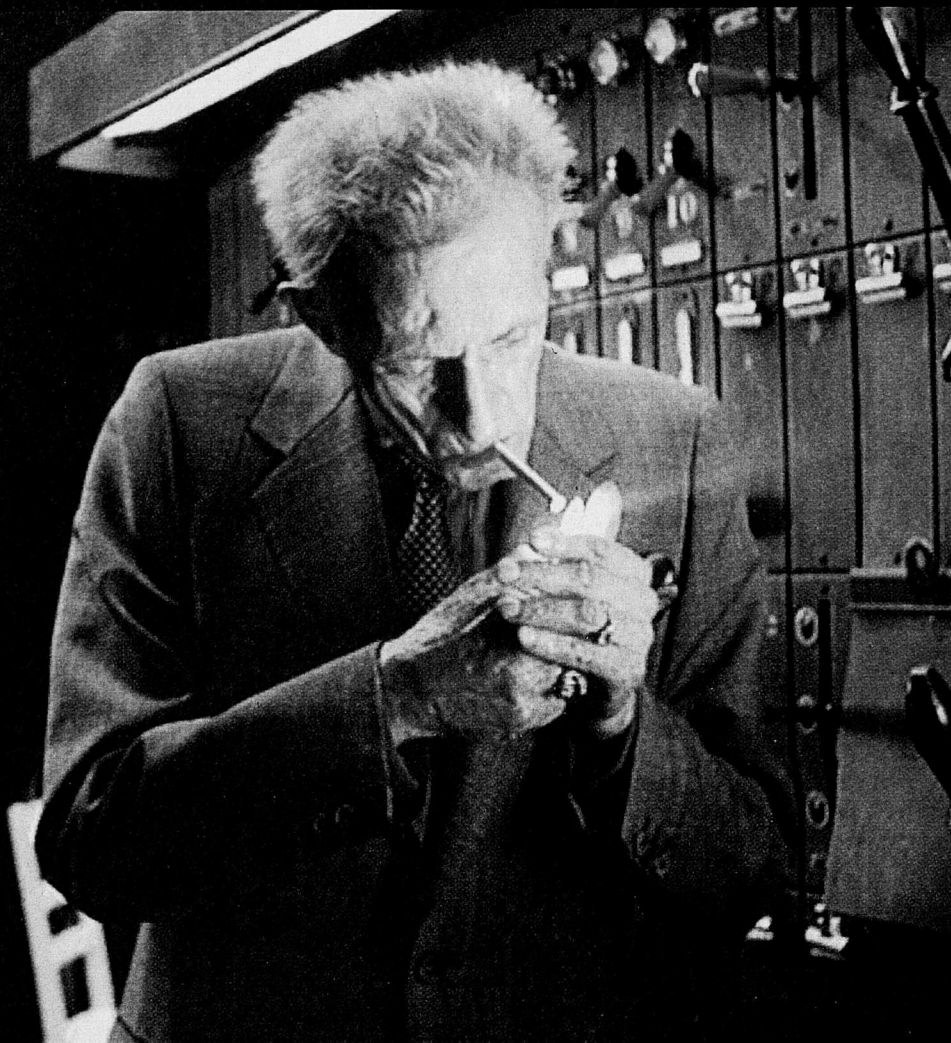
Nicholas Ray a Relámpago sobre el agua

moviment de renovació cinematogràfica que intentava portar a la pràctica el concepte bàsic obtingut a Oberhausen l'any 1962: "la necessitat de crear un nou cinema alemany", una iniciativa que va quedar arrelada més cap al sentit teòric que no pas en els resultats a través de les pel·lícules.