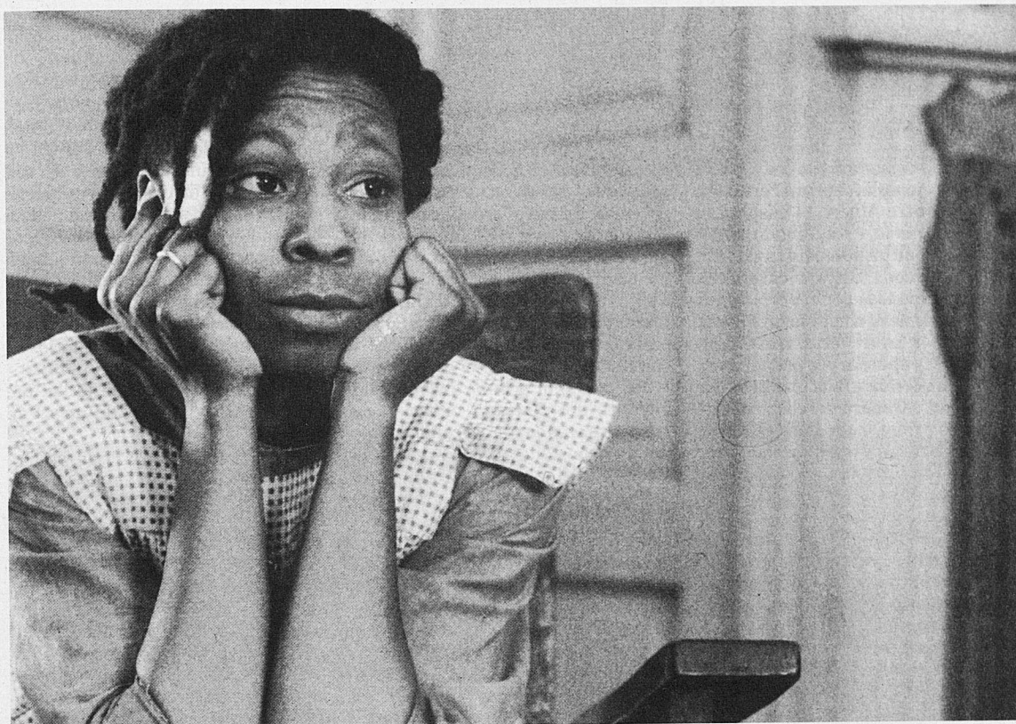
El color púrpura