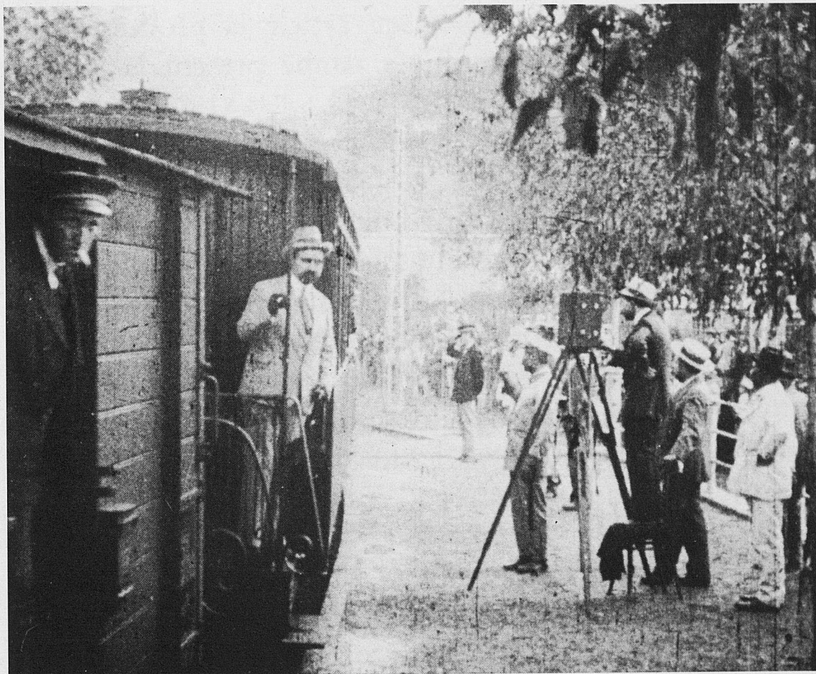
Fotograma de la pel·lícula de Josep Truyol De Palma al Puerto de Sóller (1913).