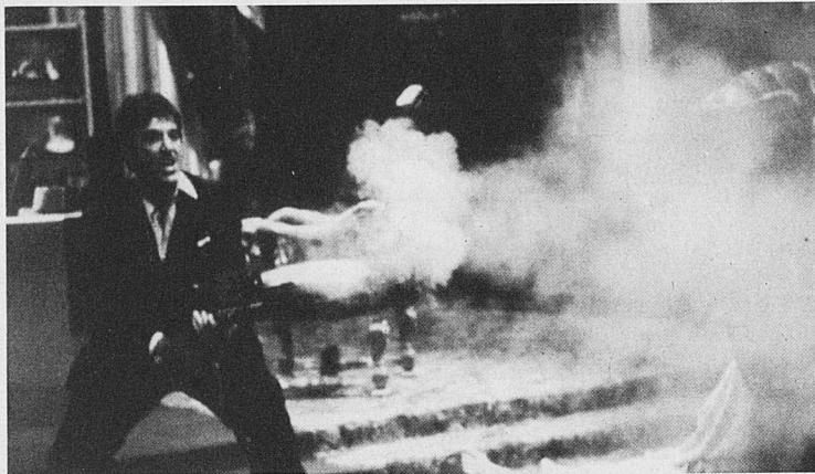
El precio del poder.