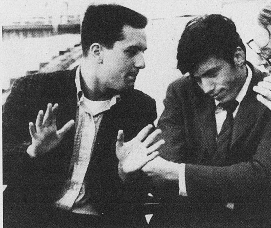
The wedding party.

mació desconeguda per l'espectador fins aquell moment. El film representa un dels cims de l'estil depalmià, en què hi tenen cabuda històries i elements heterogenis, però que són acoblats i funcionen, tant des del punt de vista narratiu —un dels punts forts del director— com els personatges que mostra a la pantalla, en què transforma una història de tall clàssic en un musical esbojarrat, un gènere de moda en aquells anys, i als qui De Palma va retre un homenatge a través d'un dels seus millors films.