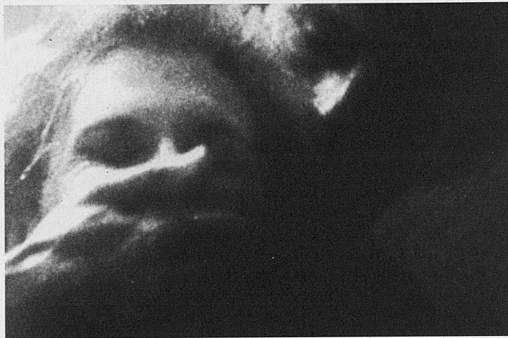
Los intocables de Elliot Ness (a dalt) i Vestida para matar (a baix).

ri New Yorker per Daniel Dang, en què denunciava una violació sexual de quatre soldats, acusats per un cinquè (en aquest cas el personatge que interpretava Michael J. Fox), no va funcionar. La mirada de De Palma sobre la guerra és massa objectiva, indiferent, potser perquè era l'argument més seriós que havia treballat fins aquell moment, lluny del tractament que havia presentat a Greetings o Hi mom! , també amb la Guerra del Vietnam com a teló de fons.