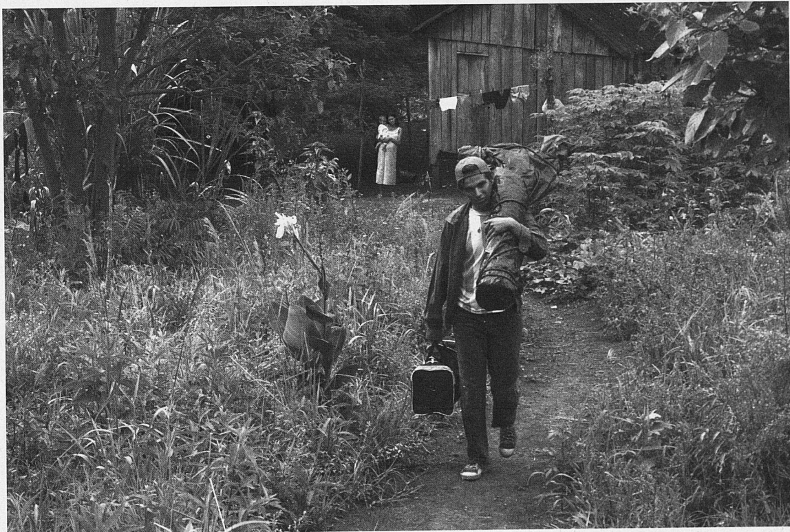
El camino de San Diego.