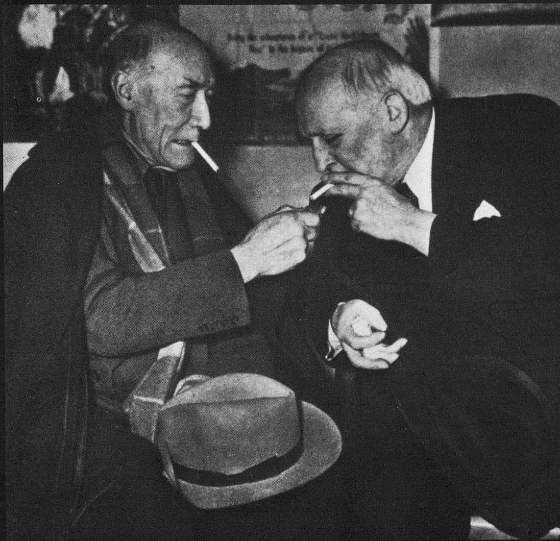
André Gide i Robert Flaherty.

nir quatre elements que li permetin començar un procés de presa de consciència de si mateix. El primer és la conjunció de les dues tendències primigènies del protodocumental: l'exhibicionisme que genera l'etiqueta de "cinema d'atraccions" i la vocació científica que forneix el nou sistema de registre de la realitat, fent aparèixer el cinematògraf com el punt culminant d'una evolució tecnològica amb impuls original en les experimentacions fotogràfiques de científics com Marey o Muybridge. El segon element és l'"experimentació poètica", propiciada per les avantguardes del començament de segle. El tercer és l'evolució d'un impuls narratiu que permeti construir una història, tant fictícia com del món real. I, com a quart element, s'ha de parlar de retòrica, com a via per a l'inseriment d'una perspectiva personal, d'una mirada sobre el món del qual es parteix per crear una impressió de veracitat.