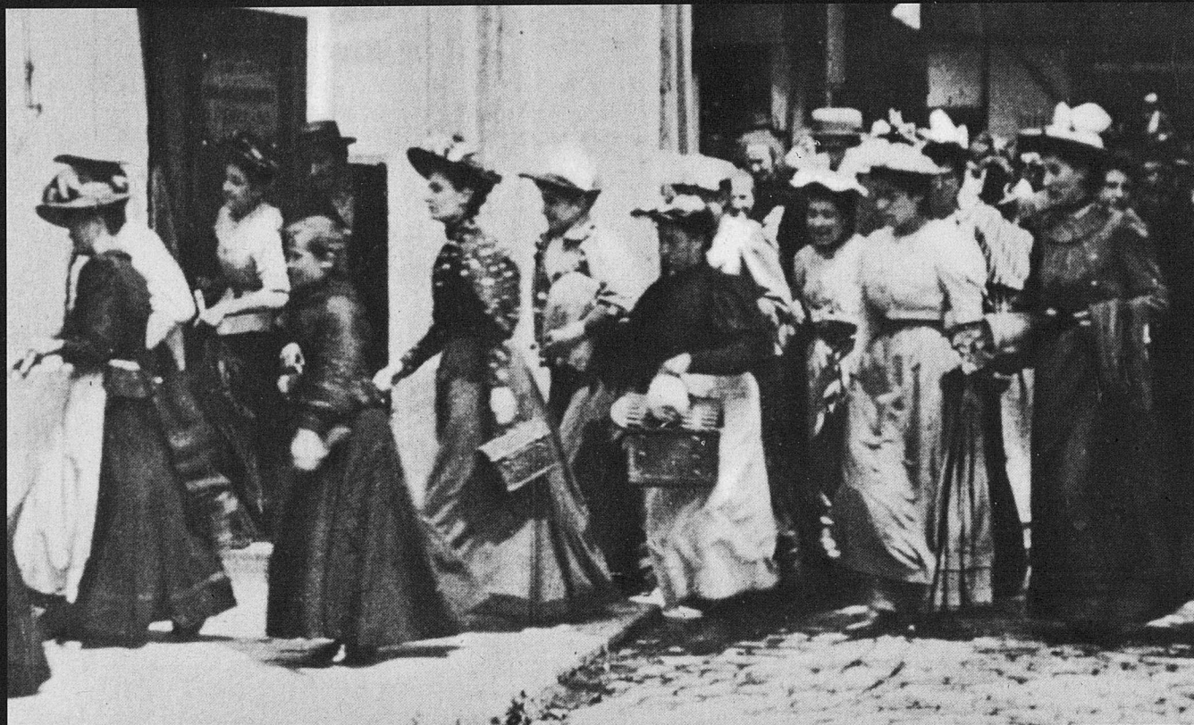
La salida de los obreiros de la fábrica.

Fa poc ha començat la seva singladura Docus Balears, associació de cineastes i productors del món del cinema documental amb la finalitat de promoure i impulsar el cinema de no-ficció a les Illes Balears. Es pretén omplir un forat buit dins de l'espai cultural i artístic de les Illes, que cap altra comunitat no es pot permetre. En col·laboració amb la Fundació Sa Nostra, Docus Balears presenta una primera mostra de cinema documental que traça un recorregut per algunes de les seves obres capitals per proporcionar una aproximació al públic de l'ample univers de la no-ficció. La programació del cicle, detallada en les pàgines finals d'aquesta revista, arrenca amb els germans Lumière i finalitza amb Alain Resnais, amb la idea de proporcionar un primer flaix de la història del documental des de 1985 a 1956. La nostra pretensió és celebrar el cicle amb una periodicitat anual, tot ampliant en properes cites el nombre de projeccions o la durada de la mostra, amb el fi d'aprofundir i estendre el retrat iniciat, alhora que es crea un focus estable d'aproximació a l'àmbit del documental. En aquesta primera edició s'ha realitzat un esforç per gestionar l'obtenció d'una còpia de La sexta parte del mundo ( Shestaya chast mira , Dziga Vertov, 1926), i, així, donar a conèixer un film de rar o nul visionat que, de no conèixer-se finalment com a part de la programació, ens deixarà un deute pendent amb el realitzador soviètic que esperam poder satisfer en el futur.