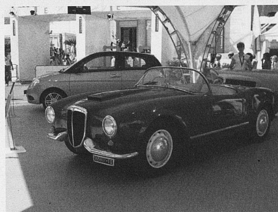
El Lancia que conduí Gasmann a Il Sorpasso .

A Venècia un dels temes de conversa era el proper festival de cine de Roma, que promogut pel batlle de la ciutat Walter Veltroni i pel president de la Fondazione Musica per Roma Goffredo Bettini, se celebrarà per primera vegada el proper mes d'octubre, del 13 al 21. Tot i que es vol donar una imatge de "no passa res, no hi ha competència" des de Venècia els comentaris no eren gaire favorables, criticant sobretot el fet que ara els doblers públics s'hauran de repartir. Un dels punts febles de Venècia són les infraestructures, aspecte en el qual Roma duu avantatge. Al diari La Repubblica es podia llegir un article que comentava "és una guerra freda, in-