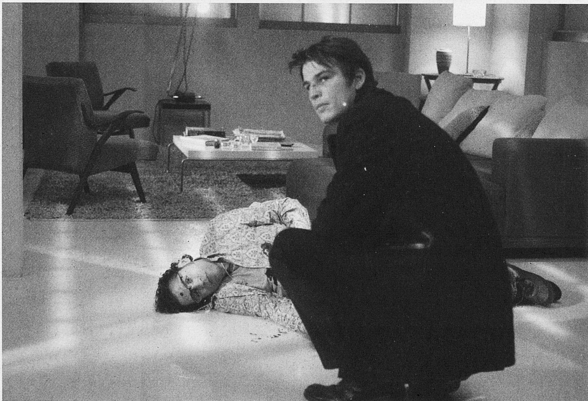
El caso Slevin.