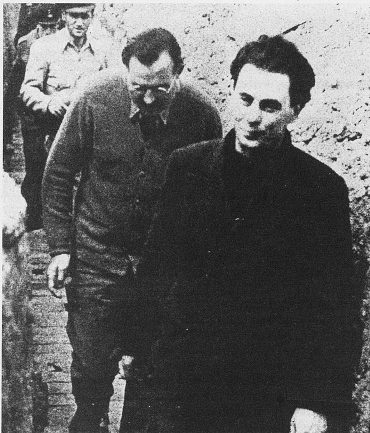
Foto esquerra: Ernest Hemingway i Joris Ivens, durant el rodatge de Tierra de España .