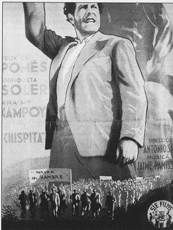
Cartell d'Aurora de esperanza.

El suport de cineastes nord-americans es materialitzà també amb dues produccions de la productora progressista Frontier films que roda els