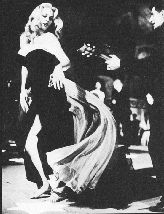
La dolce vita.

banda, el caràcter cinèfil de Fellini en la definició d'aquella femme fatale amb què es troba, precisament, dins una sala de cinema. Igualment trista és la definició que fa Fellini de l'altra cara del matrimoni, la ingènua Sandra, dels seus patiments i del seu amor immens cap a Fausto. No vull deixar de recordar aquella preciosa escena a la sortida del cinema en què Sandra li confessa que té por (no sap exactament de què), tot i que aquesta por li fuig quan el té al costat. Però, com és inevitable pels ingenus en aquest esfereïdor món nostre, rep bufetades de per totes bandes, a més de la cruel befa de les seves suposades amigues que, en un instant de guió realment brillant, li fan un autèntic bombardeig d'indirectes letals sobre el caràcter del seu marit i sobre el seu embaràs accidental.