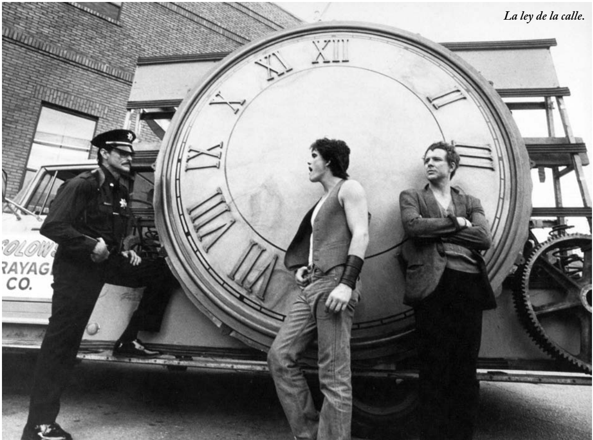
La ley de la calle.