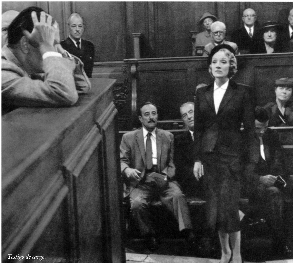
Testigo de cargo.

a Henry V , dos films anteriors (1948 i 1945). Fins i tot, ¿per què he de mentir?, quasi em va passar desapercebut a Rebecca de Hitchcock (1940) i, esper que no em perdonin la gosadia o irreverència (encara que a mi no m'ho sembli), la inoblidable Marilyn Monroe se'l va menjar, pel que fa a l'aspecte interpretatiu (i no sé si en un altre i més eròtic sentit, que a mi ja m'hauria agradat que se'm mengés la Monroe, ¿i a vostès?), en el film del tot cursi The Prince and the Showgirl . Sí, amics meus, ja sé que les impertinències són tolerables fins a un cert punt, i que vostès —no els marcarà la raó— em citaran altres obres com Spartacus , Carrie (els record que la dirigí Wyller) o, fins i tot, The Devil's Disciple , films on Olivier evidencia les seves qualitats d'actor. No tenc cap intenció,