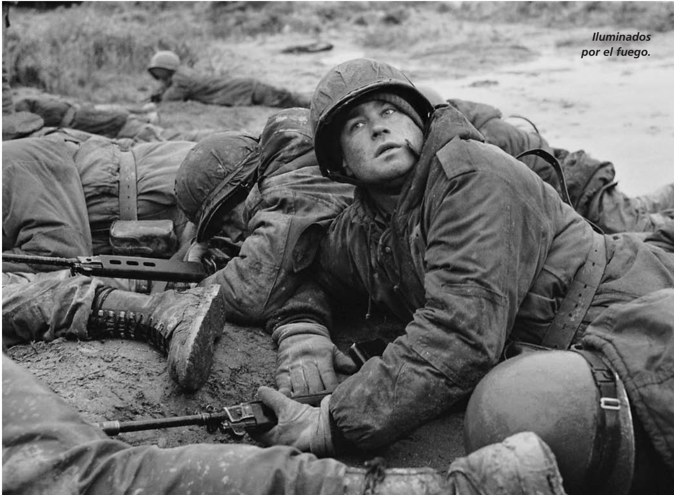
Iluminados por el fuego.