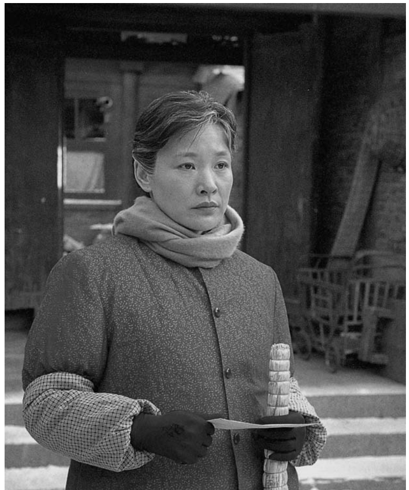
Xiang ri kui.

petició. El particular món de Gillian serveix ara per recrear la vida d'una nina, els pares de la qual són ionquis , en una casa enmig d'un gran camp de blat, amb l'única companyia d'uns veïnats, dos germans que conserven el cadàver de la seva mare esperant que li torni la vida. Ti-