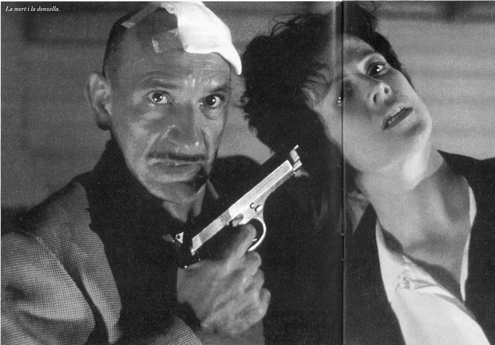
La mort i la donzella.

Capra, Lubitch, Wilder, Sturges, Hitchcock, Zefirelli, Frears, Brannagh, i tants d'altres, han sabut superar els condicionaments teatrals que no escènics de les obres que han traslladat a la pantalla, creant el moviment de la càmera, trencant amb el punt de vista únic de l'espectador, omplint els espais i usant del primer pla per a expressar les emocions contingudes en la paraula. Han compartit amb noves expressions un territori comú. ■