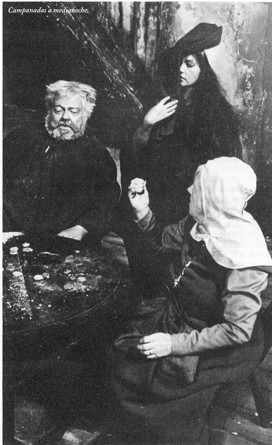
Campanadas a medianoche.

Però ara i aquí importa poc decantar-se per uns o per l'altre i decidir si els guionistes tenien tota la raó i tot el dret d'apiadar-se de la bella bruixa (evidentment, ho feren per raons comercials: es tractava de compondre un final que, si no podia ser feliç, fos, al menys, poc depriment), o si la raó estava de la part del creador original de la criatura. La contradicció no gens fútil és du aquí per a subratllar que mentre el pas de la novel·la al cinema permet i suporta, amb justificació o sense ella, canvis més o menys radicals que poden arribar a afectar el mateix relat, això difícilment pot passar en tractar-se d'adaptar el teatre al cinema, és a dir, la peça teatral al film. Valgui aquest altre exemple: per interessant que ens pot resultar el personatge de Brutus, en el Juli Cèsar de Mac-