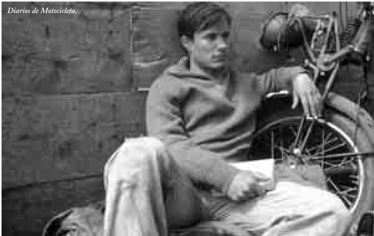
Diarios de Motocicleta.

I ara, els nous de trinca: John Debney, un compositor amb moltíssimes feines de tot tipus a la seva esquena (sèries de televisió, pel·lícules fetes per al mercat videogràfic, etc.) ha arribat als Oscars per primera vegada gràcies a La Pasión de Cristo ( The Passion of the Christ , Mel Gibson, 2004), una partitura que ens agrada i ens fa pensar que tal vegada John Debney és un nom a tenir en compte. Però sens dubte, la gran sorpresa ha estat el premi, que és per un altre nou de trinca i, aquest sí, tot un descobriment: Jan A. P. Kaczmarek, qui amb Descubriendo Nunca Jamás ( Finding Neverland , Marc Foster, 2004) ens ha deixat veritablement bocabadats, perquè la seva partitura és enlluernadora i inoblidable. Aquest compositor polonès gairebé desconegut (seves són les partitures d' Aimée & Jaguar , Max Färberböck, 1999— o Infidel — Unfaithful , Adrian Lyne, 2002—, per citar les més conegudes) ha entrat a l'Olimp per la porta gran, sense més mèrits que una feina molt ben feta. Així, doncs, moltes felicitats, encara que si Mr. Eastwood hagués arribat a temps per presentar la candidatura de Million Dollar Baby (Clint Eastwood, 2004, amb la qual va guanyar el Globus d'Or), potser la baralla hagués estat una mica més encarnissada. ■