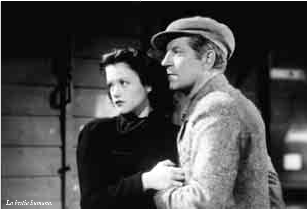
La bestia humana.

res a la seva gran passió: la pintura. Maurice coneix Lulu, una jove de la vida perdudament enamorada de Dédé, un antic militar dedicat a negocis bruts, que té com a guanys principals els ingressos que li proporciona Lulu exercint la prostitució. Dédé i Lulu decideixen aprofitar-se del bo de Maurice, qui per poder pagar els capricis de la jove comença a fer robatoris de la caixa de la botiga. En no ser suficient aquestes petites quantitats per satisfer la cobdícia de Dédé, Lulu aconseguirà que Legrand li regali alguns dels seus quadres. Els contactes de Dédé en permetran treure profit, fent creure que Lulu és la vertadera creadora de les obres. Tot es complicarà amb l'aparició del primer marit de la dona de Maurice, a qui tothom donava per mort. Legrand, en veure la il·legimitat del seu matrimoni, comprèn que ha trobat la situació ideal per allunyar-se de la seva dona i poder compartir la seva vida amb Lulu. Serà llavors quan topàrà amb tota la veritat i compregui que Lulu no sent res per ell, i que ha estat només el finançador dels negocis de Dédé. Humiliat i rebutjat, qui era un home afable i tranquil desperta tota la seva ira, cosa que tindrà conseqüències dramàtiques pels tres vèrtexs del triangle.