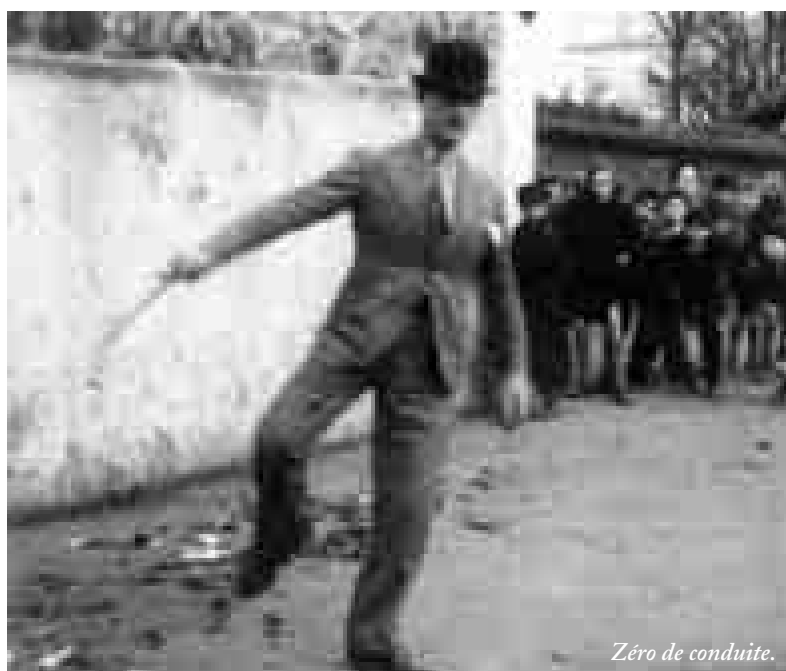
Zéro de conduite.