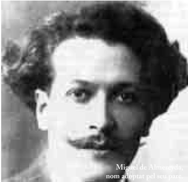
Miguel de Almereyda, nom adoptat pel seu pare.