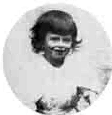
Jean Vigo a 1907, als dos anys.

Vigo, historia de una pasión , de Julien Temple. 1997