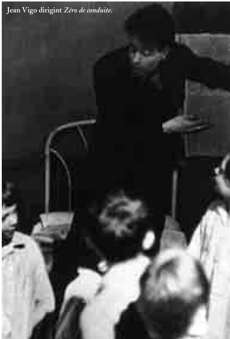
Jean Vigo dirigint Zéro de conduite .

en plantejar el seu món en imatges, en plantejar-lo a la pantalla.