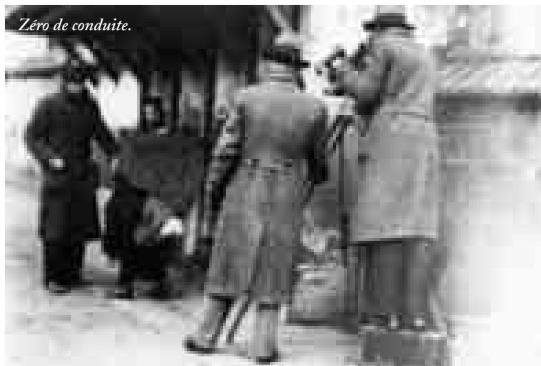
Zéro de conduite.