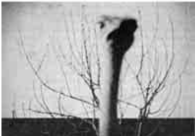
À propos de Nice.