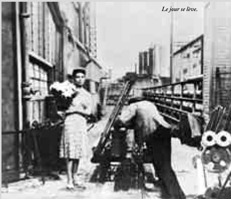
Le jour se lève.

lesa un concepte ombrívol del món i pessimista del home. Així doncs, Quai des brumes , desenvolupada a la zona portuària de Le Havre, es tanca amb el tràgic final de Jean tot just quan intentava fugir cap a Brasil amb Nelly.