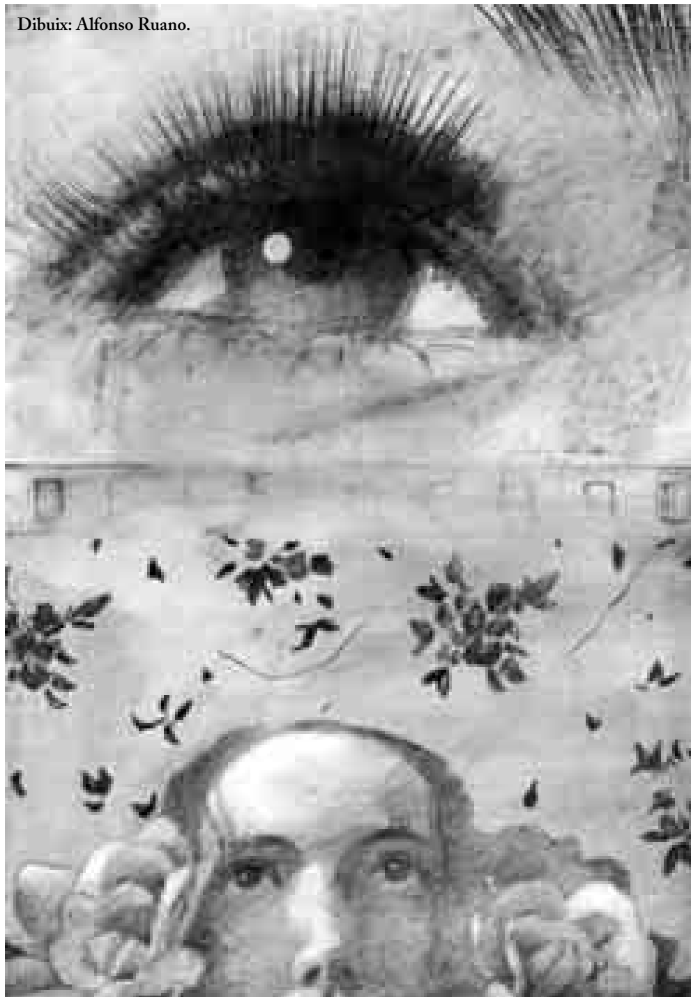
Dibuix: Alfonso Ruano.

Quan va constatar que seguia amb la mateixa atenció fins i tot l'últim rètol del copyright , va saber, amb tota certesa, que aquella era la dona de la seva vida. I, ara que l'havia trobada, no deixaria passar l'ocasió d'agafar-li, de tant en tant, en la càlida obscuritat d'un cine qualsevol, la mà. 🎬