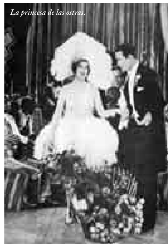
La princesa de las ostras.

El cinema que es feia reflectia correctament els signes de l'època i revelava els creixents perills socials i polítics a Alemanya. Del 1933 al 1945, el setè art està sota la fèrula del Tercer Reich. Era l'època de Joseph Goebbels, ministre de propaganda del règim. No es podia fer cap pel·lícula sense la seva autorització. Des del 1938 cap jueu no podia treballar en la indústria cinematogràfica. Tot plegat va fer que 1500 artistes del cinema no poguessin exercir la professió: actors, guionistes, compositors. En tot cas, una part important de la història del cinema alemany va continuar viu a l'exili, fet que va tenir com a conseqüència el fet que les pel·lícules rodades a l'exili ja no es considerin part de la cinematografia alemanya. ■