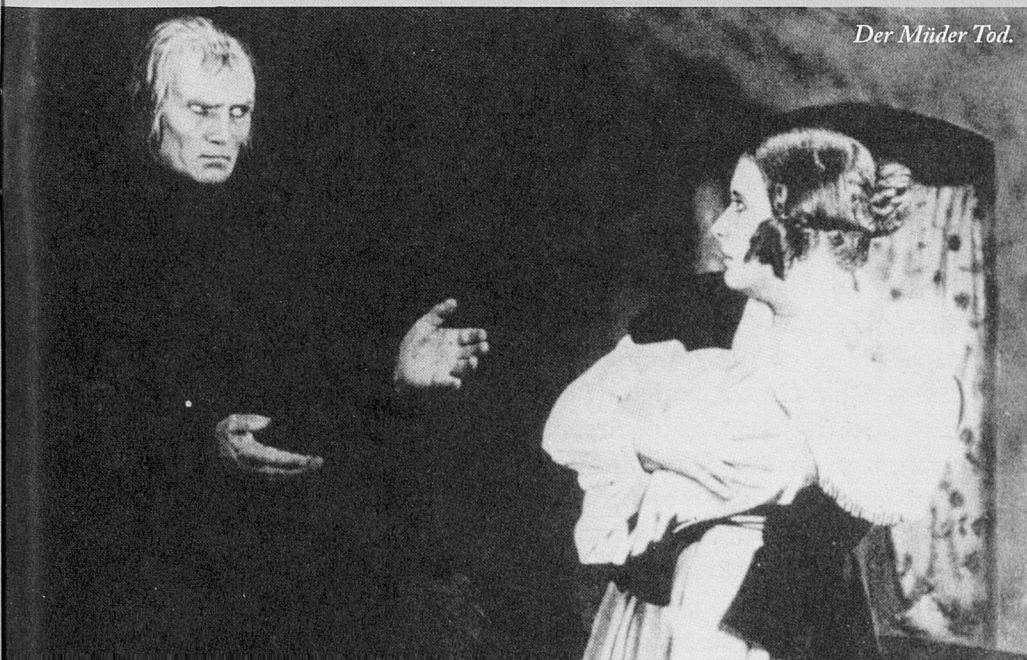
Der Müde Tod.