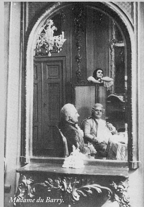
Madame du Barry.