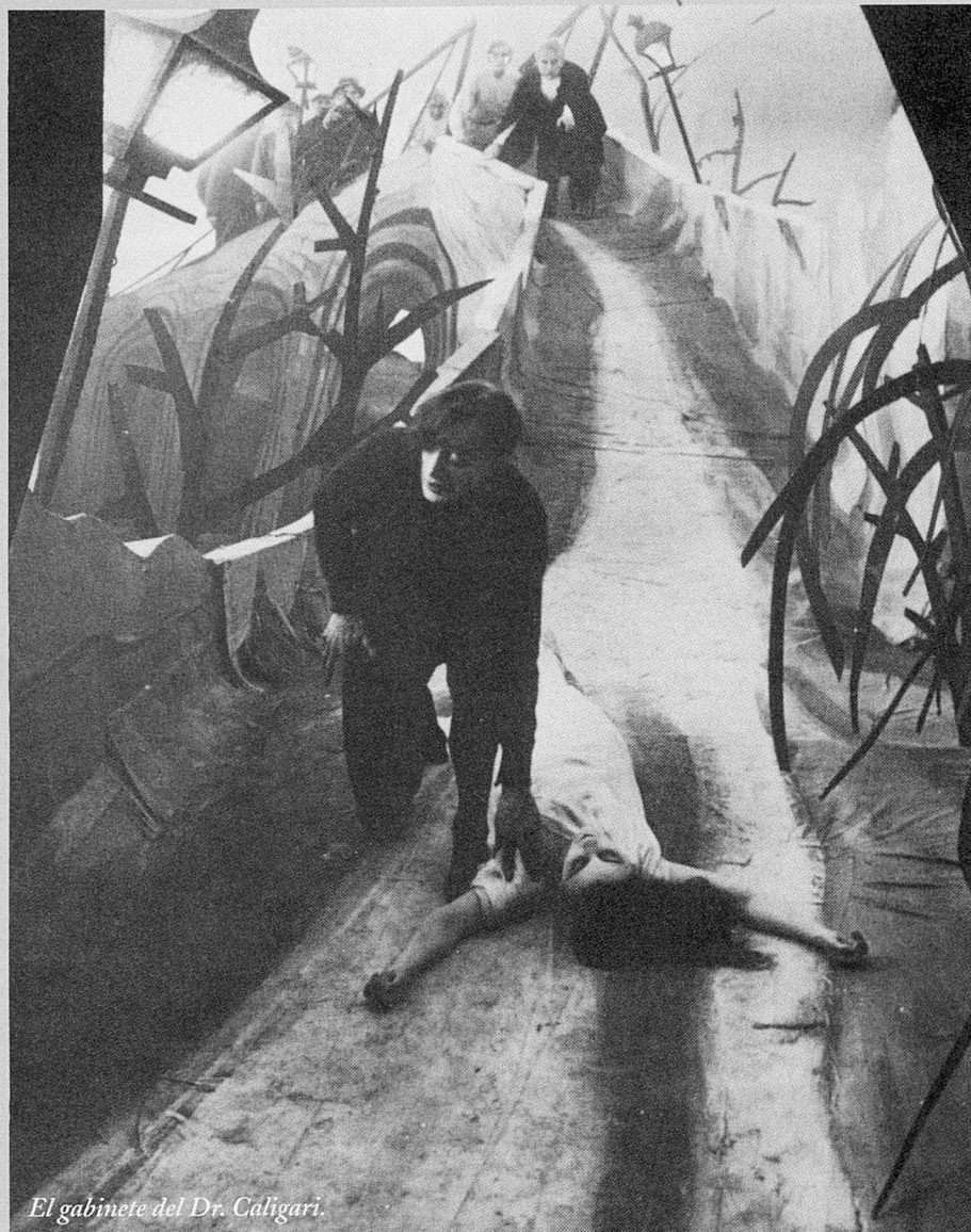
El gabinet del Dr. Caligari.