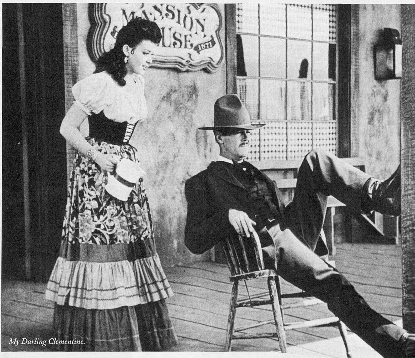
My Darling Clementine.