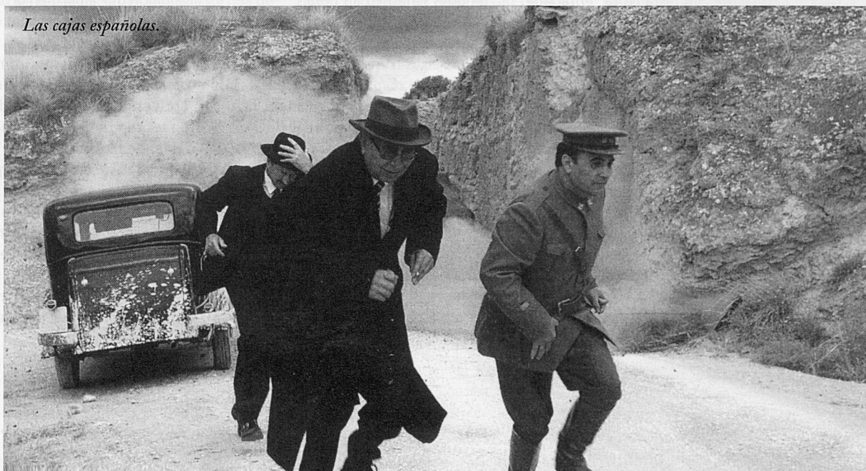
Las cajas españolas.

Christopher Doyle, Lai Yiu Fai i Kwan Pun Leung, per 2046