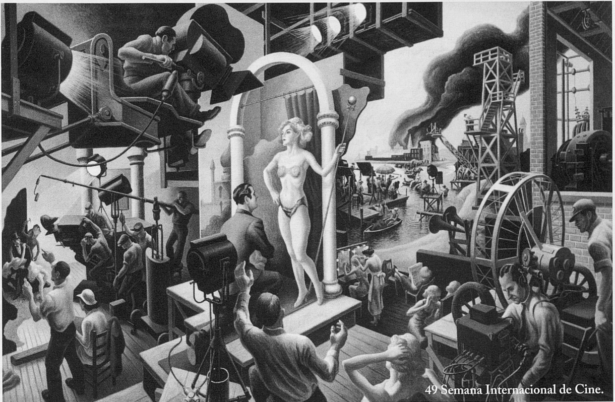
49 Setmana Internacional de Cine.

E ntre els dies 22 i 30 d'octubre se celebrà la 49ena Setmana Internacional de Cine de Valladolid. Un certamen que, sense cap dubte, es pot considerar com uns dels millors festivals de classe B (els de sèrie A son Cannes, Berlín, Venècia i Sant Sebastià).