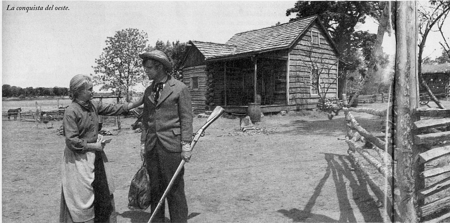
La conquesta del oest.

meres, una centrada perpendicularment respecte a l'objecte i les altres dues als laterals, fet que implicava que també es necessitessin tres projectors (que funcionessin, a més, a 26 fotogrames per segon, no a 24) i una pantalla corba segons un angle de 165 graus. El problema del cinerama, a la meua manera d'entendre, no està en les distorsions patides quan es veu per televisió (es noten sobretot a les línies d'unió entre els tres fragments verticals d'una mateixa imatge). És més o menys el que passa amb el format panoràmic en general o amb aquelles pel·lícules amb una fotografia que deixa un gran paper a les zones fosques: es diu allò de "per televisió perden"; s'hi pot reaccionar dient que estan pensades per veure's en una sala de cinema. El primer cas, vist que això de mutilar-les i passar-les a format full-screen és prendre el pèl a l'espectador, s'està intentant solucionar amb els televisors panoràmics i, en el segon, amb la major qualitat aportada pel DVD (facin la prova de mirar Sin perdón en VHS i després en DVD i veuran més coses de la pel·lícula la segona vegada). Crec més aviat que el problema del cinerama estava en la seva incomoditat a l'hora de filmar, sobretot quan es treballava en