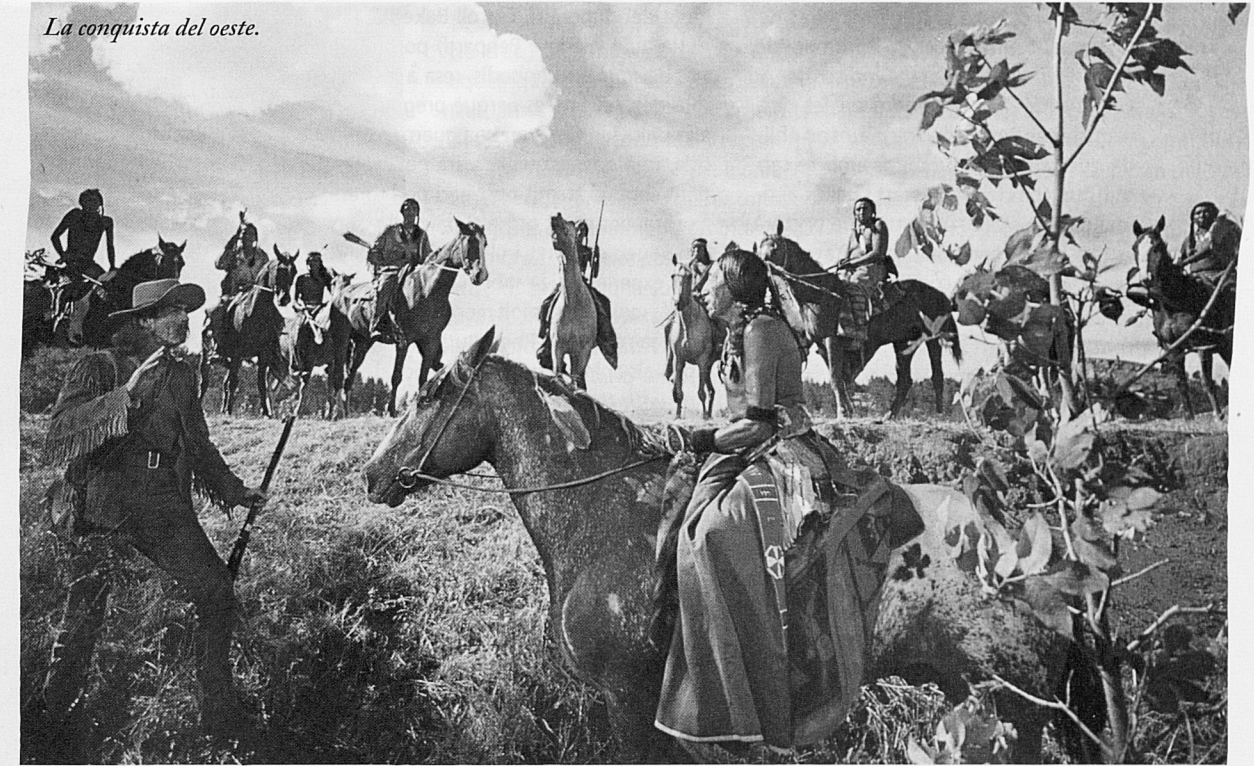
La conquesta del oest.

ment directors actuals com Michael Bay ( Armageddon ), que contribueixen així a la mala fama que té el cinema americà de mirar-se el llombrigol sense descans.