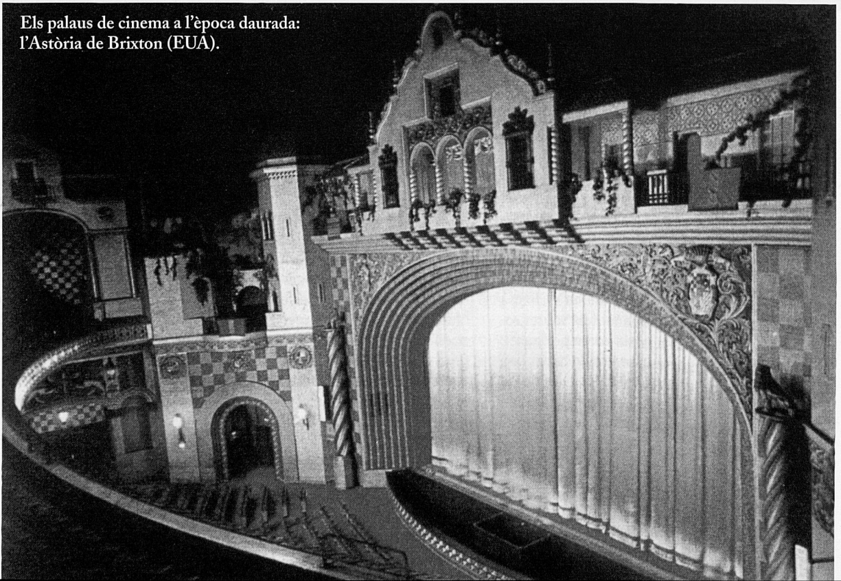
Els palaus de cinema a l'època daurada: l'Astòria de Brixton (EUA).

La tristesa d'Anarene és la tristesa de tants de cinemes que moriren i de la impotència, la resignació o la indiferència amb què les gents contemplaren, en molts de casos, aquesta desaparició. La tristesa d'Anarene és la de la mort d'aquell tren d'il·lusió i de fantasia que passava puntualment tots els dissabtes i diumenges d'hivern pel meu poble —i si l'anyada havia estat abundosa i generós l'esplet d'ametlles, també ho feia els dijous, excepcionalment—, en aquella Mallorca rural, agrícola, tradicional i parsimoniosa, avui tan perduda i esbucada com els meus anys infantils. I alhora que desapareixien les velles sales dels pobles, que venien a ser com les estacions d'aquell "tren dels somnis" que era el cinematògraf, anaven morint, gairebé simultàniament, com si tot formàs part aquí també d'una mateixa agonia, els inoblidables ferrocarrils que ens havien unit durant dècades amb altres localitats i amb la capital de l'illa, en un temps en què, com diria el meu amic Cristòfol Carrió, Ciutat, encara, "queia enfora". 7 I les velles estacions fèrries es clausuraven així com anaven tancant les sales de teatre i de cinema. El temps de la bellesa havia passat. Havíem progressat molt i tot allò ja no interessava. Quan ens vol-