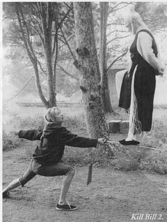
Kill Bill 2.

gonna part, he repassat la de la primera (publicada a la revista del mes d'abril) i he de reconèixer que no anava desencaminat quan l'acabava amb les paraules següents: "no m'ha acabat de fer aquesta barreja d'estil i músiques per contar una història de revenja ben simple, però també admet que mereix esperar a la segona part per fer-ne una valoració més precisa." Per què? Per la raó que, una vegada vistes en conjunt, el resultat global hi surt guanyant bastant. Són dos contrapesos ben conjuntats que equilibren una de les pel·lícules més interessants del 2004.