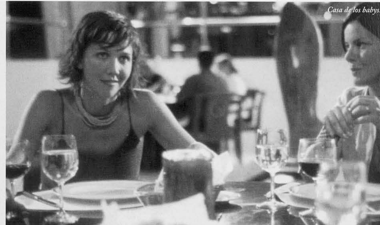
Casa de los babys.

pel nord-americà John Sayles i que segurament no hauria passat desapercibuda si s'hagués estrenat fora de vacances. La raó d'aquesta informació tan rotunda sense haver-la vista? La font